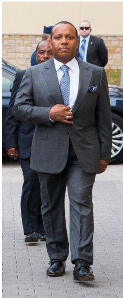
Патрис Эмери Тровоада – Сан-Томе және Принсипи премьер-министрі