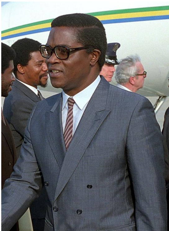
Мануэль Пинту да Кошта – Сан-Томе және Принсипи Демократиялық Республикасының қазіргі президенті