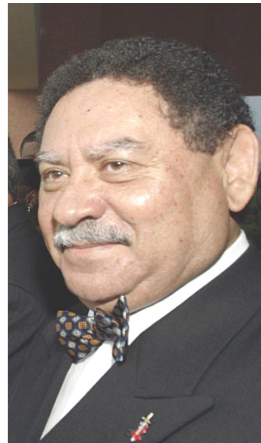
Фрадике Бандейра Мелу де Менезеш – Сан-Томе және Принсипи Демократиялық Республикасының үшінші президенті