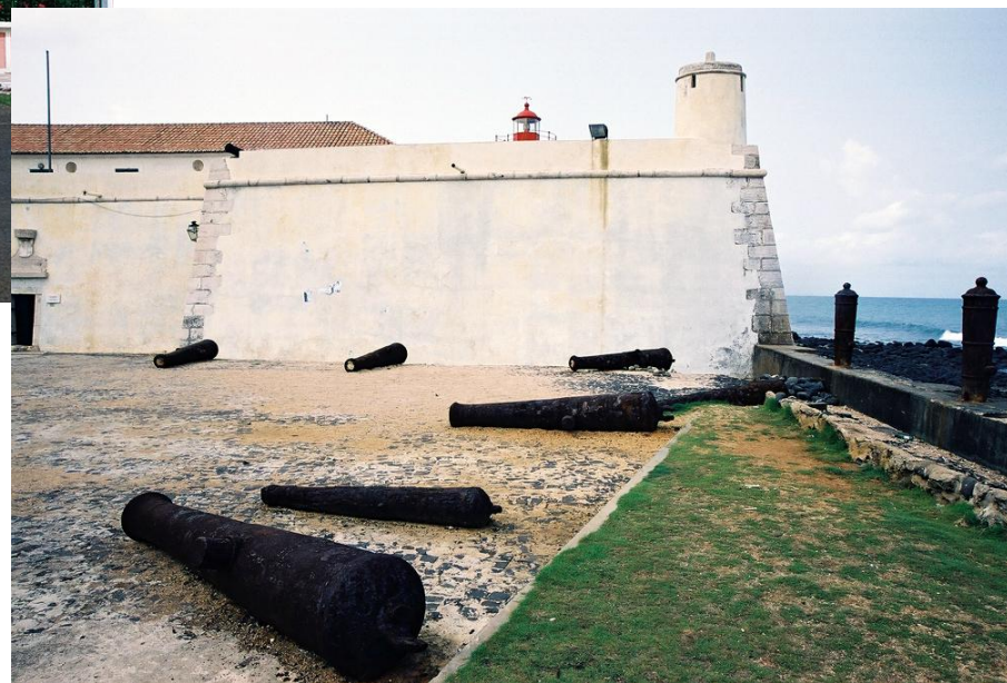
Сан – Себастьян форты