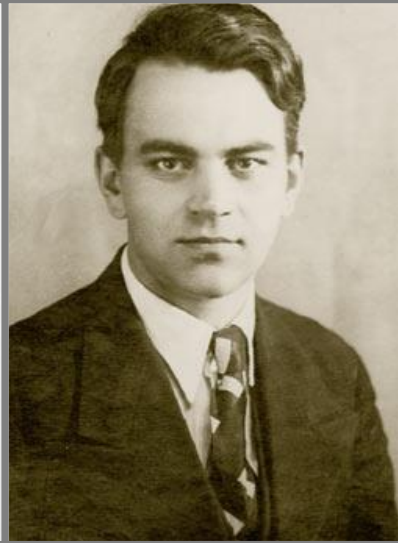
М. В. КЕЛДЫШ