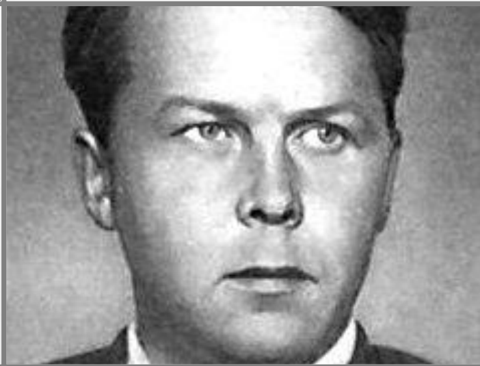
А. Т. ТВАРДОВСКИЙ