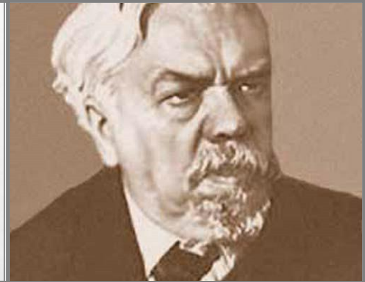
С. А. ЧАПЛЫГИН

РАЗРАБОТКИ ПРИВЕЛИ К СОЗДАНИЮ НОВЫХ ОБРАЗЦОВ БОЕВЫХ САМОЛЕТОВ , СОЗДАНИЮ РАДИОЛОКАТОРОВ , НАЧАЛИСЬ РАБОТЫ ПО СОЗДАНИЮ ЯДЕРНОГО