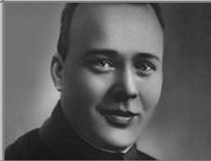
А. П. ГАЙДАР

КАЖДЫЙ ЧЕТВЕРТЫЙ ИЗ НИХ НЕ ВЕРНУЛСЯ С ВОЙНЫ. ОСЕНЬЮ 1941 Г. ПОГИБ ИЗВЕСТНЫЙ ДЕТСКИЙ ПИСАТЕЛЬ А. П. ГАЙДАР. ВО ВРЕМЯ ВОЗВРАЩЕНИЯ ИЗ ОСАЖДЕННОГО СЕВАСТОПОЛЯ БЫЛ УБИТ ОДИН ИЗ АВТОРОВ САТИРИЧЕСКИХ РОМАНОВ "ДВЕНАДЦАТЬ СТУЛЬЕВ" И "ЗОЛОТОЙ ТЕЛЕНОК" Е. ПЕТРОВ.