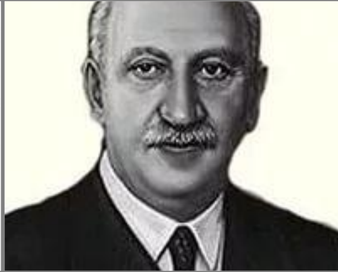
А. Ф. ИОФФЕ