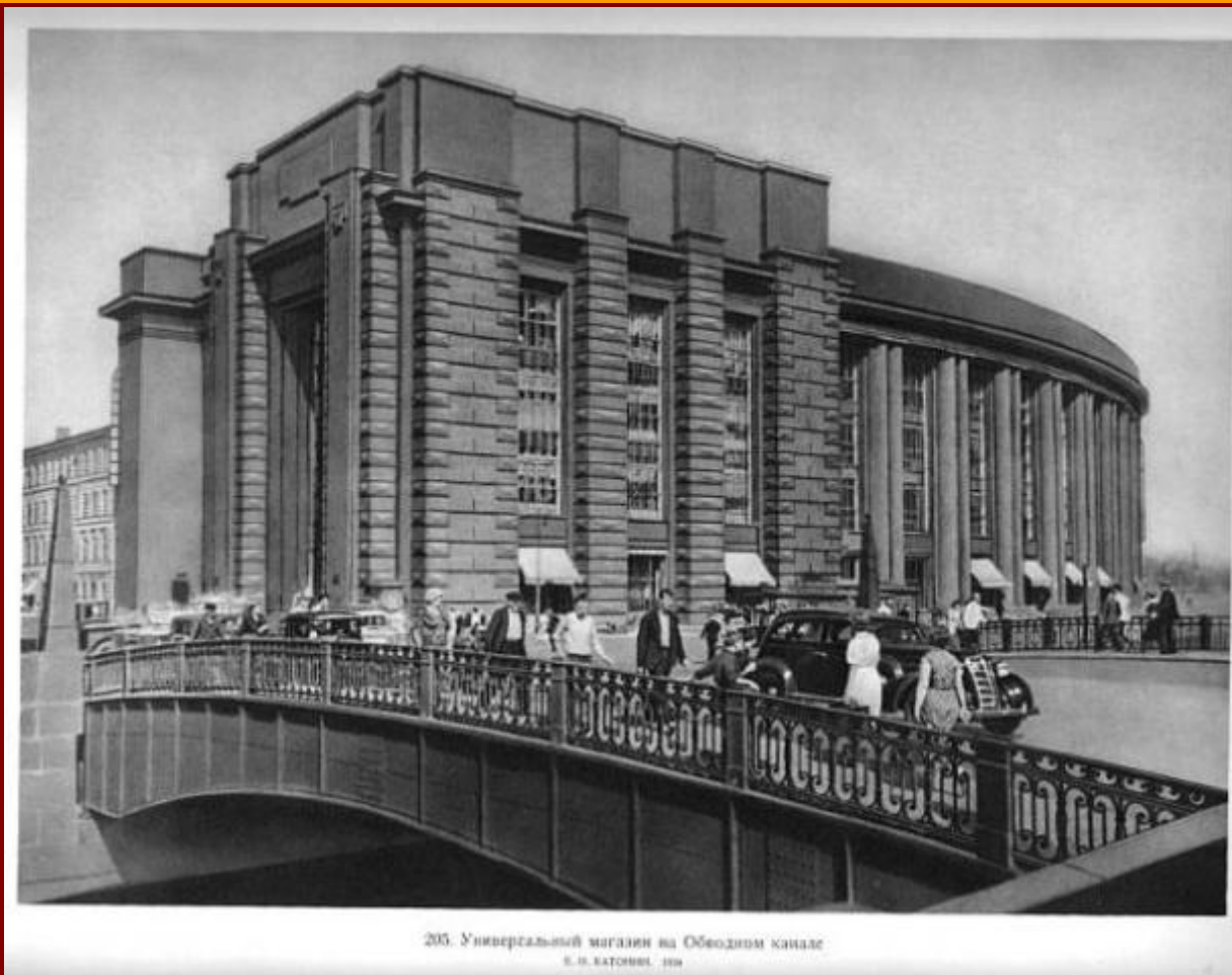
205. Универсальный магазин на Обводном канале Е. И. КАТОНИН. 1934