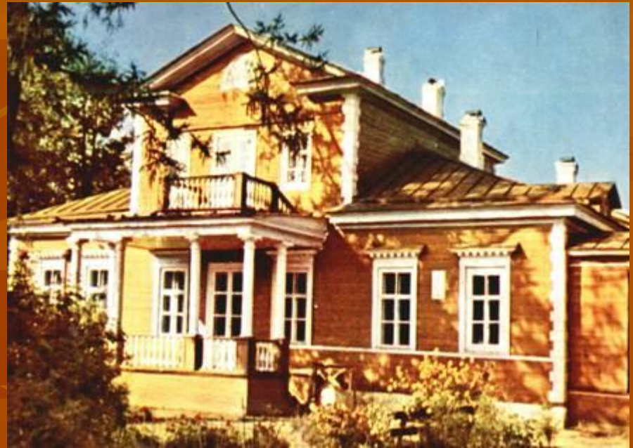
Дом Пушкина .Болдино.