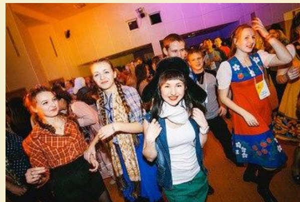
Открытый Сбор Студенческого Актива