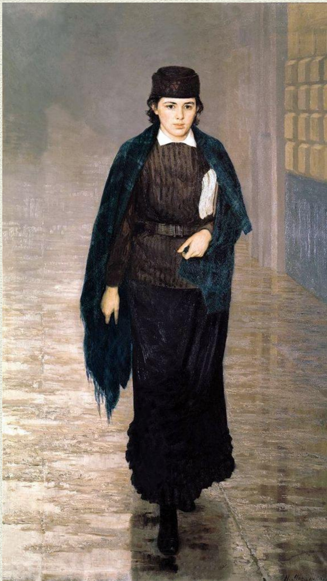
Н.А. Ярошенко, «Курсистка», 1883 год