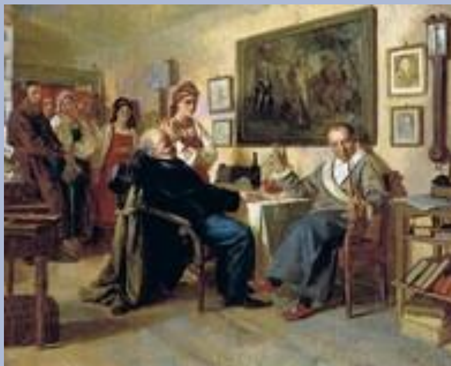
Торг Сцена из крепостного быта (Россия) (Художник Н.В. Неврев)