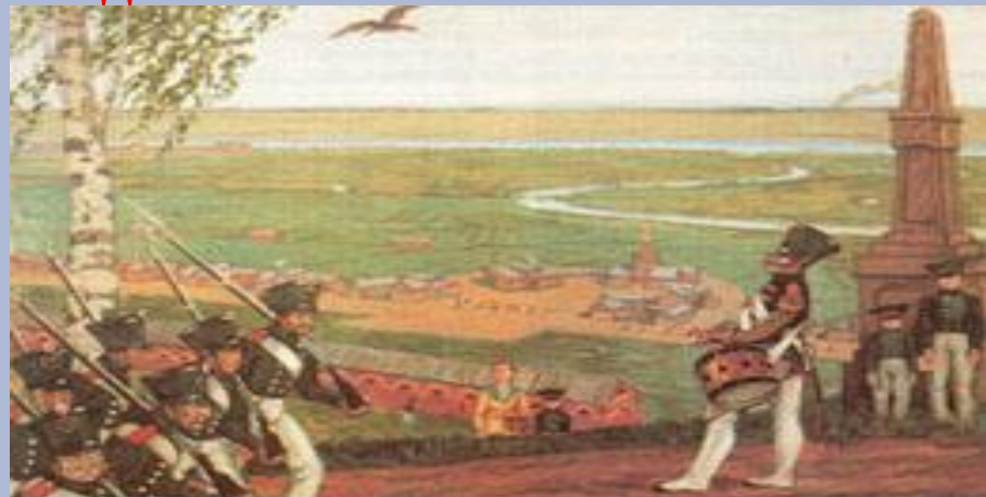
М. Добужинский. В военном поселении