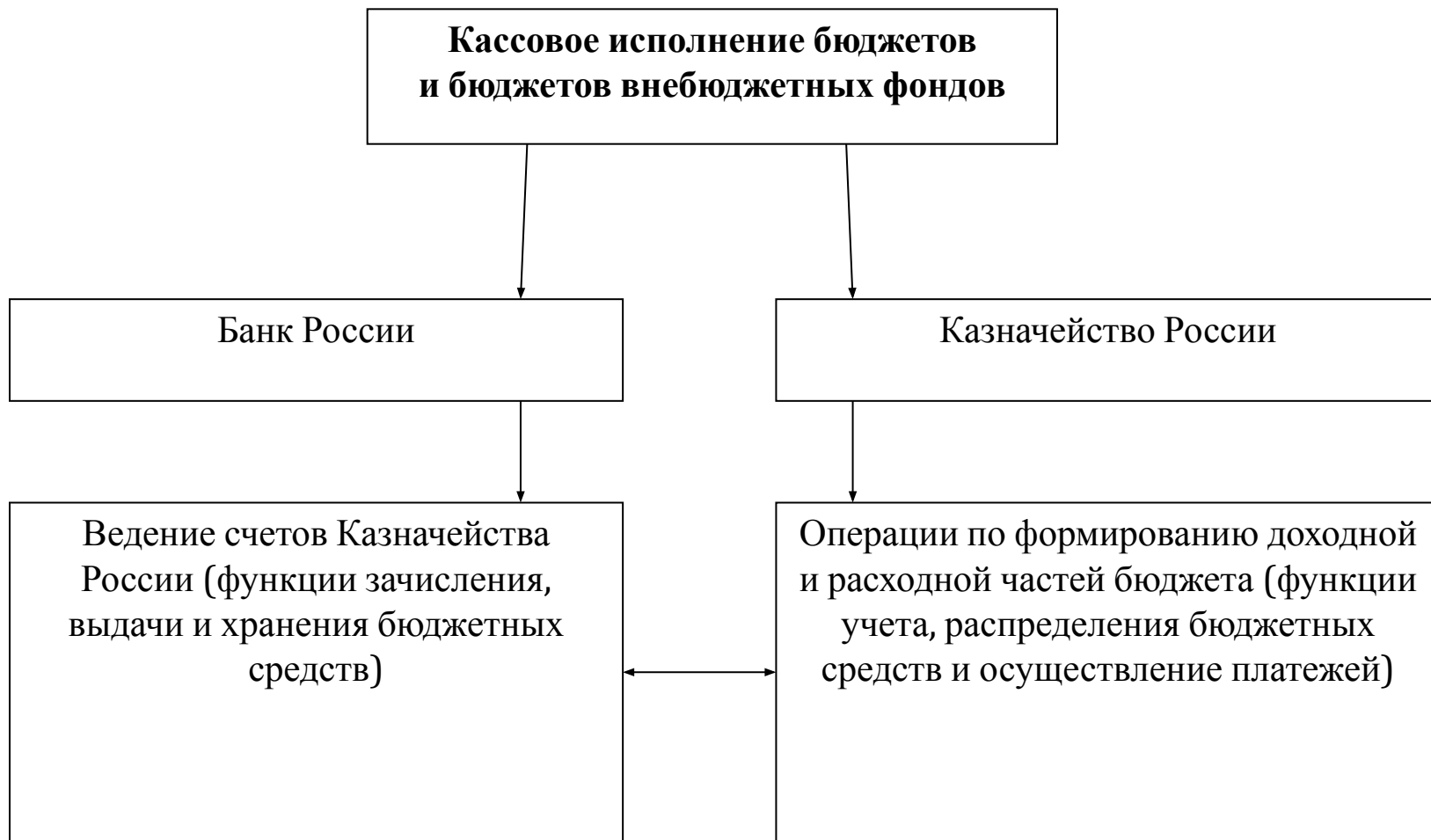
Схема взаимодействия Казначейства России и Банка России в процессе кассового исполнения бюджетов и бюджетов внебюджетных фондов