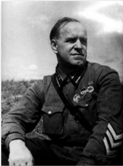
Комдив Г. Жуков на Халхин-Голе

1939 г. – вторжение Японии в Монголию. СССР оказал военную помощь Монголии. Вооружённый конфликт, продолжавшийся с весны по осень 1939 года у реки Халхин-Гол на территории Монголии, закончился разгромом японских войск.