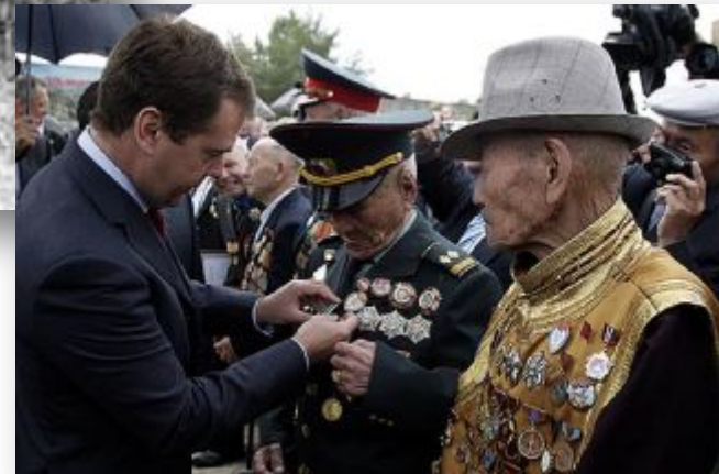
Д. А. Медведев вручает российские награды ветеранам Халхин-Гола (Улан-Батор, 2009)