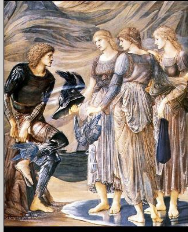
Персей и морские нимфы. 1877 год.

Во время странствия Персей встретил прекрасных нимф, которые тоже подарили ему три подарка, пригодившихся при добыче головы Медузы: шлем – невидимку, сандалии с крыльями, безразмерную сумку.