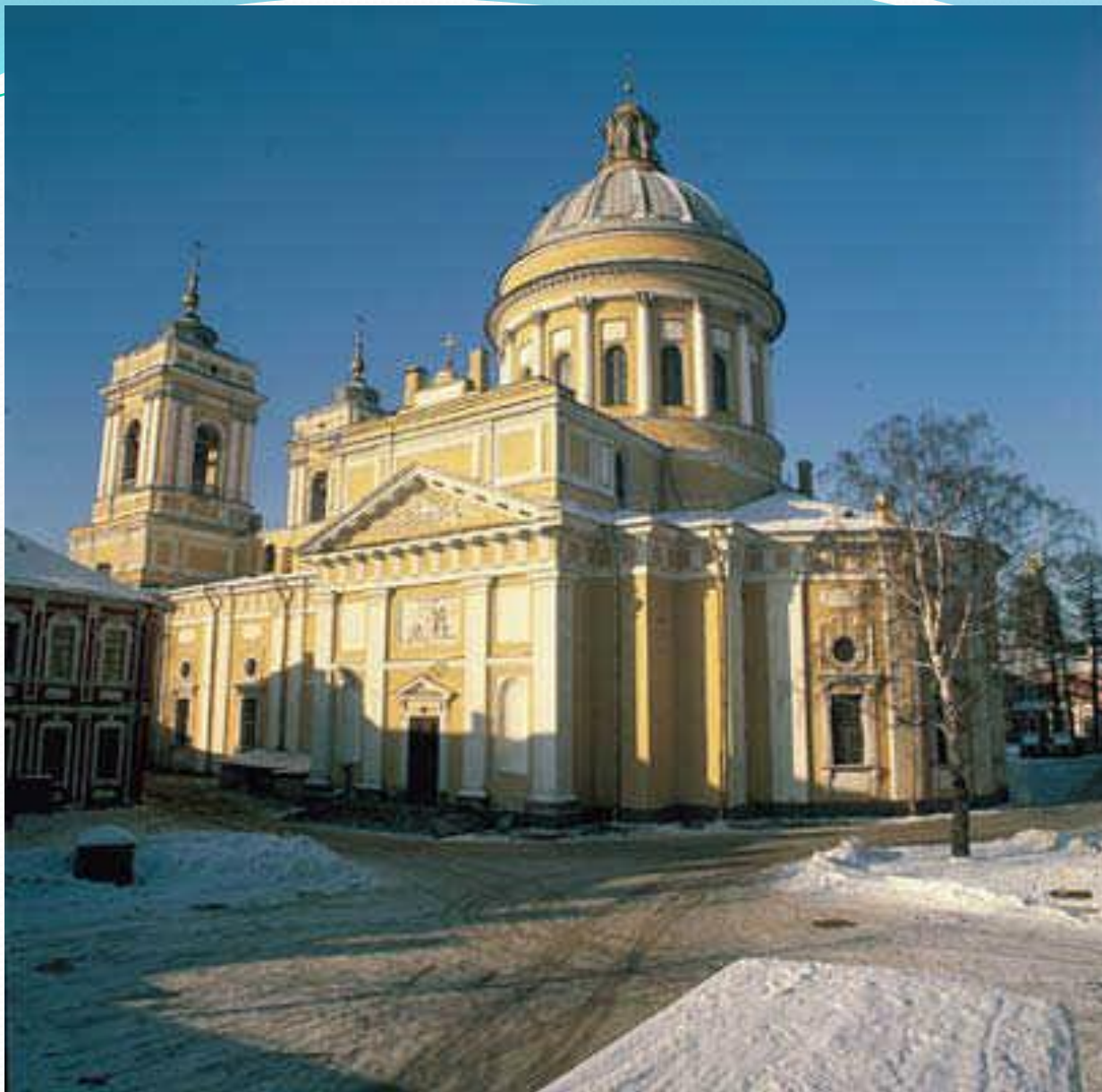
Александро –Невская Лавра