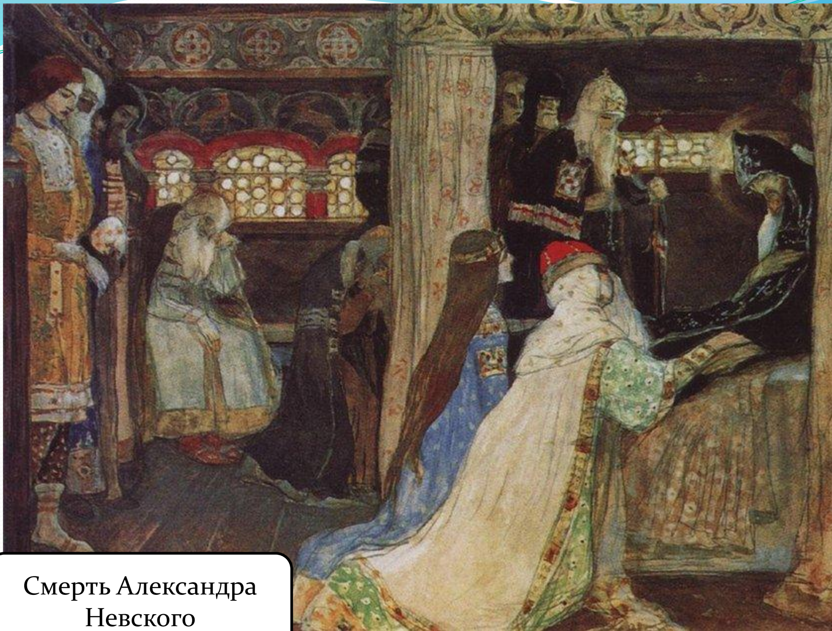
Смерть Александра Невского