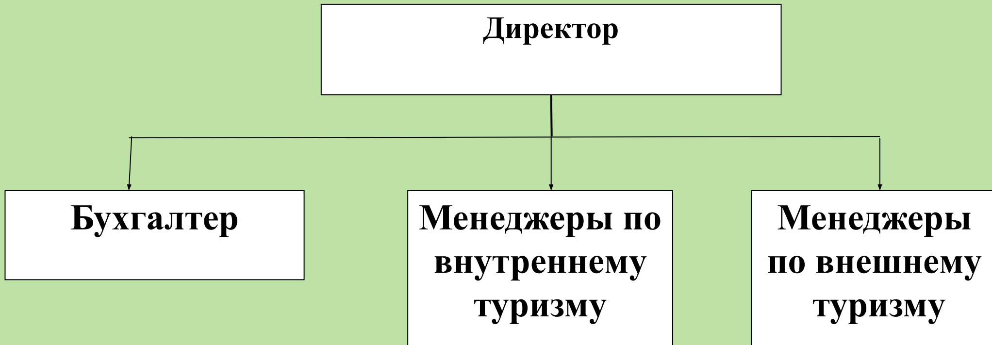
Рисунок 1 - Организационная структура турагентства «География»