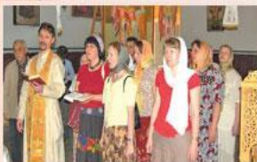
Молитва в православном храме