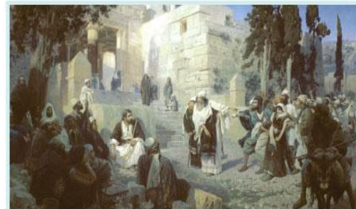
В. Поленов. Христос и грешница (Кто без греха?)

Зло надо обличать и надо его ненавидеть. Но человек и его дурной поступок (грех) не одно и то же. В православии есть правило: «Люби грешника и ненавидь грех». А «любить грешника» означает «помочь ему избавиться от его греха».