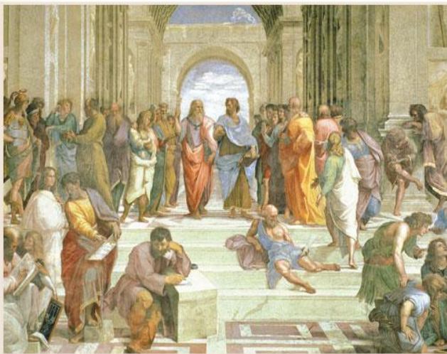
Рафаэль. Афинская школа. Фрагмент

Этика изучает мораль. Слово «мораль» возникло в Древнем Риме и означает «при-