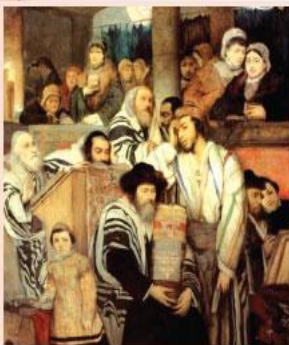
Молитва в синагоге. Художник М. Готтлиб

М ы говорили, что религия — это связь человека и Бога. Так, мы помним, что в Библии говорится: человек призван восстановить разорванную связь с Богом. Что же он должен делать? Одним из центральных действий верующего человека является молитва.