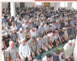
Молитва в мечети

В буддизме молитва, или мантра (в переводе — изречение), не обращена к Богу, которого не знает буддизм. Она служит для того, чтобы правильно «настроить» сознание человека, вывести его из зависимости от всего преходящего и суетного. Между тем буддисты могут совершать и собственно молитвы, обращённые к людям, которые уже достигли просветления, нирваны, или к духам, покровителям буддизма. Духам также иногда приносят символические дары — кусочки еды, воду, полоски красивых тканей.