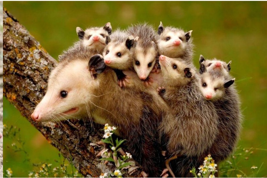
Рис.4-5 Самка опоссума с детенышами на спине

Беременность длится 12—13 суток, в помёте до 18—25 детёнышей. Лактационный период продолжается 70—100 дней. Некоторые опоссумы вынашивают детёнышей в сумке, но у большинства она отсутствует . Подросшие детёныши путешествуют вместе с матерью, держась за шерсть на её спине. Половозрелость наступает в 6—8-месячном возрасте; продолжительность жизни 5—8 лет.