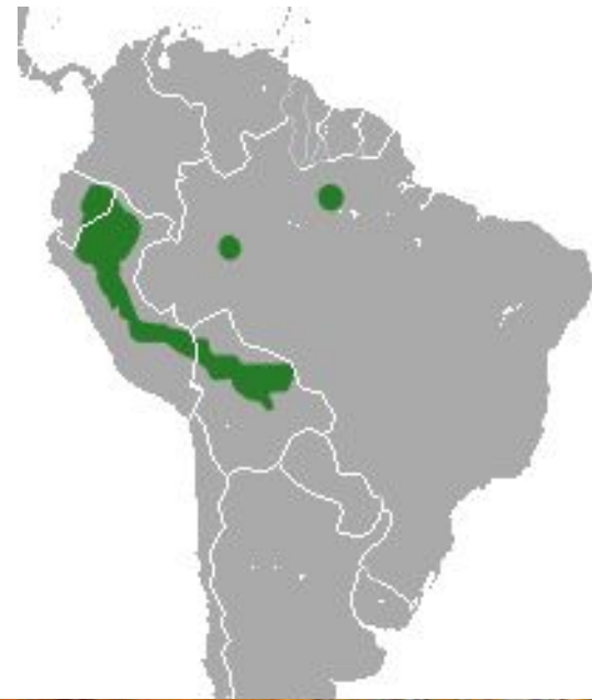
Рис. 11-13 Внешний вид и ареал обитания пушистохвостого опоссума ( Glironia venusta )