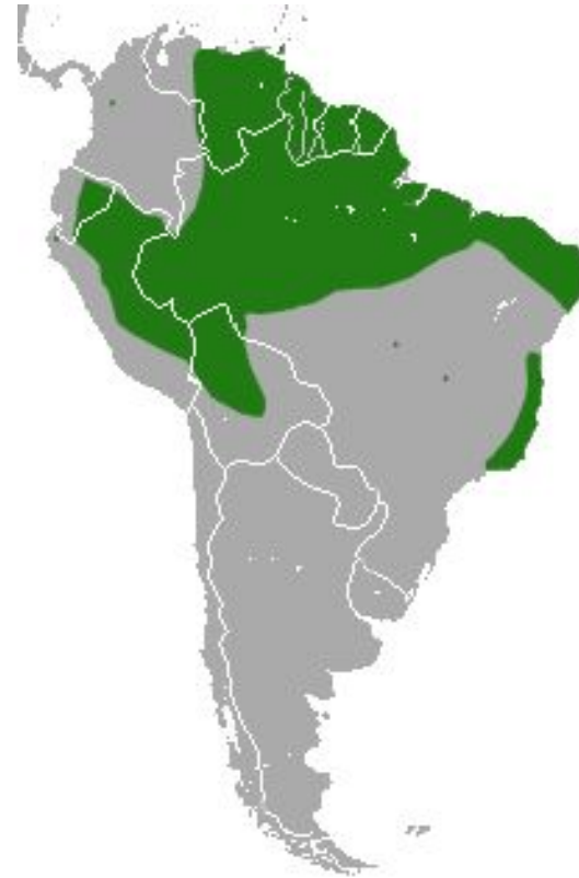
Рис.19-21 Внешний вид и ареал обитания энеевой мыши( Marmosa murina )