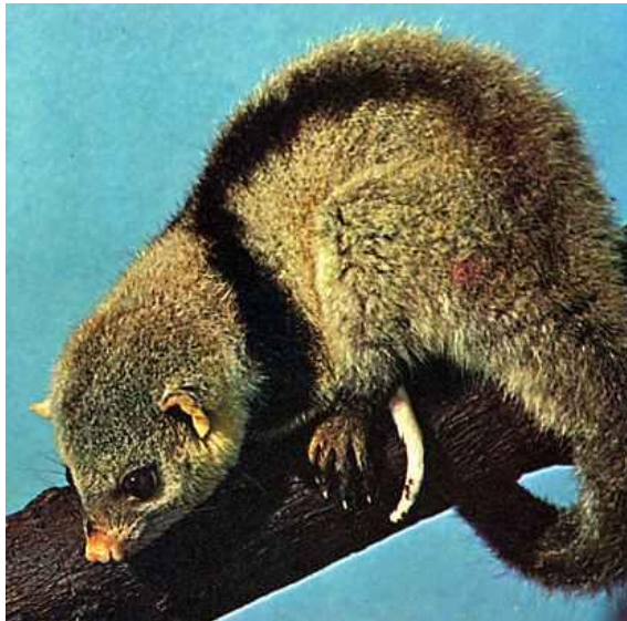
Рис.8-10 Внешний вид и ареал обитания полосатого опоссума( Caluromysiops irrupta )

Полосатый густошёрстный опоссум, или полосатый опоссум (лат. Caluromysiops irrupta )