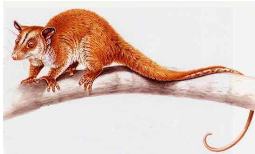
Рис. 5-7 Внешний вид и ареал обитания голохвостого пушистого опоссума ( Caluromys philander )