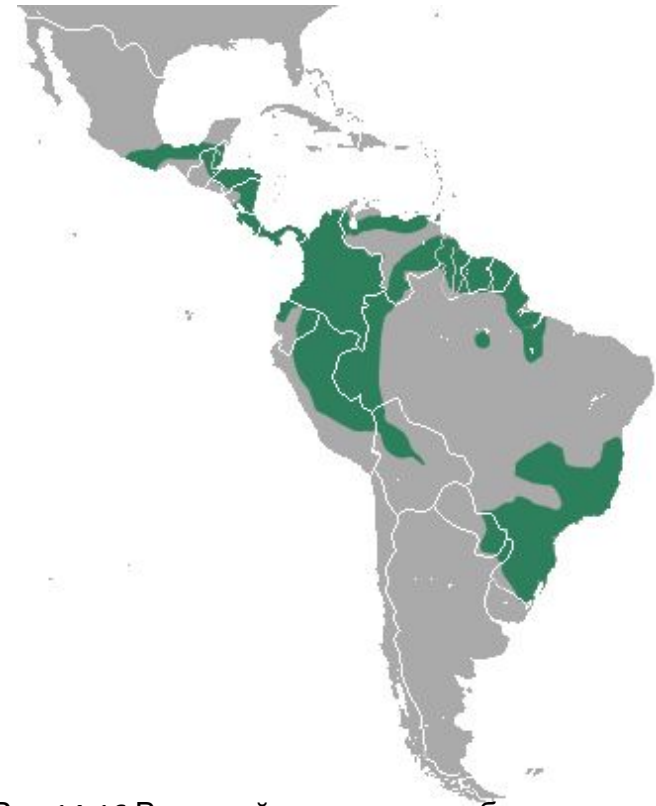
Рис.14-16 Внешний вид и ареал обитания водяного опоссума( Chironectes minimus )