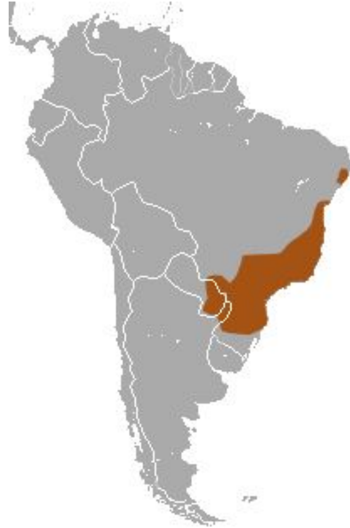
Рис.17-18 Внешний вид и ареал обитания большеухого опоссума( Didelphis aurita )