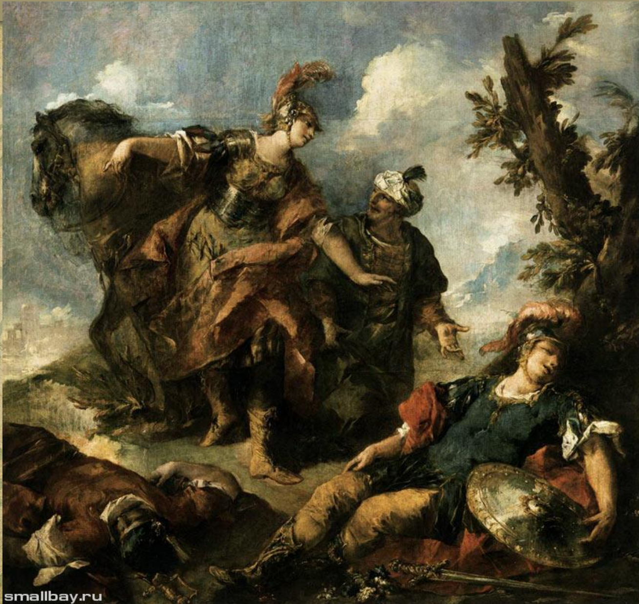
□ «Эрминия и Танкред» 1750-1755