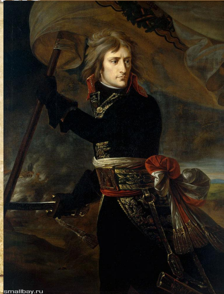
«Наполеон Бонапарт на Аркольском МОСТУ»

□ Гро Антуан Жан Французский художник-академист, мастер исторической живописи и портретист. Антуан Жан Гро родился 16 марта 1771 года в Париже.