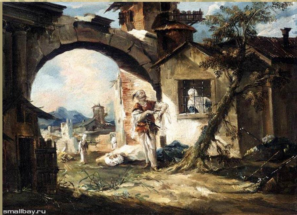
□ «Влюбленный турок»