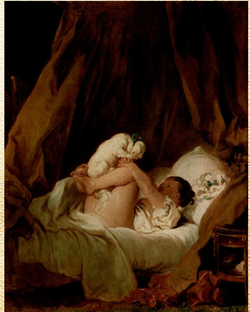
▣ Девочка в постели, играющая с собачкой