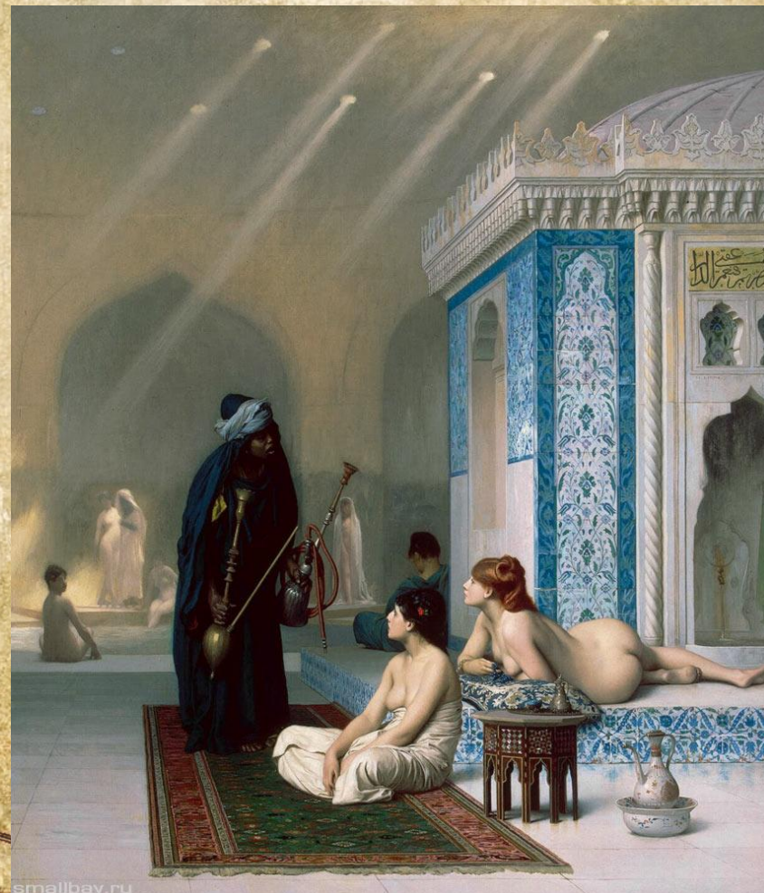
«Бассейн в гареме»

Жером Жан-Леон Французский живописец и скульптор, прославившийся колоритными картинами весьма разнообразного содержания, преимущественно изображающими быт античного мира и Востока.