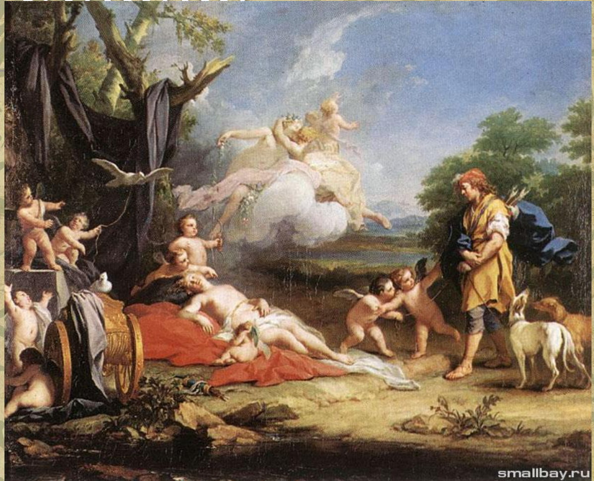
«Венера и Адонис»

□ Амигони Якопо Итальянский живописец, рисовальщик, гравёр. Учился в Венеции у А. Балестры, а затем у А. Беллуччи из Тревизо, возможно, помогая ему в 1705 – 1711 в работах для замка Бенсберг в Дюссельдорфе.