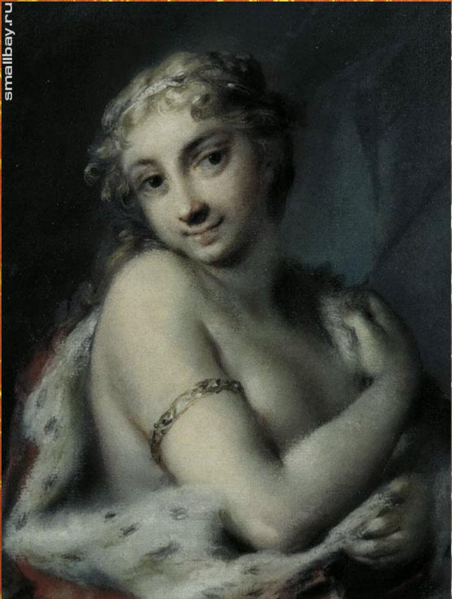
Каррера Розальба «Зима»