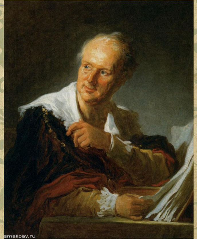
□ «Портрет Дени Дидро» Жан Оноре Фрагонар