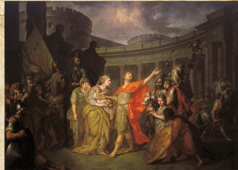
Лосенко Антон Павлович «Прощание Гектора с Андромахой»

Реализм являлся олицетворением идеалов низших сословий- купцов, ремесленников, крестьян.