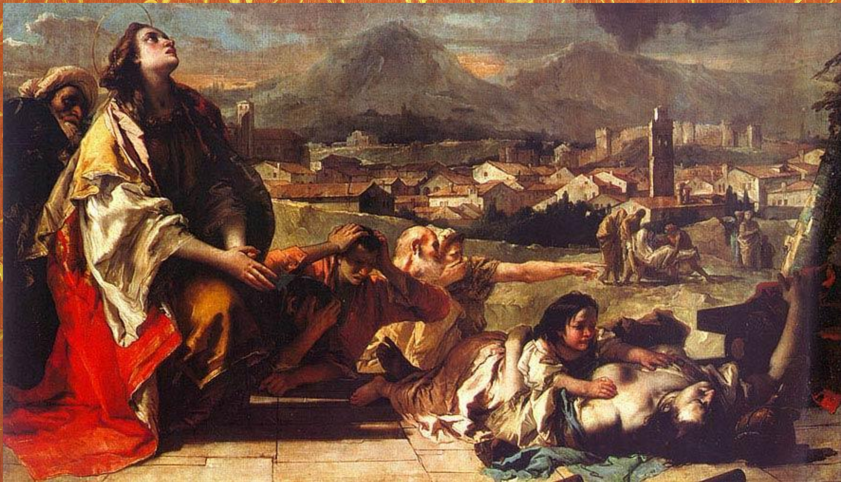
Тьеполо Джованни «Святая, спасающая город от чумы»