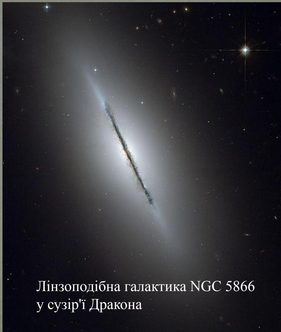
Лінзоподібна галактика NGC 5866 у сузір'ї Дракона

галактика — тип галактик, проміжний між еліптичними та спіральними в класифікації Хаббла. Лінзоподібні галактики — це дискові галактики (як і, наприклад, спіральні), які витратили свою міжзоряну матерію. Характерною особливістю лінзоподібних галактик є ступінчасте зменшення яскравості від центру до периферії.