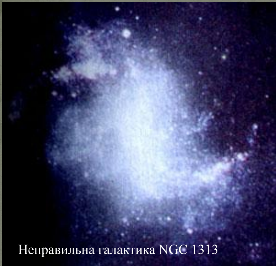
Неправильна галактика NGC 1313