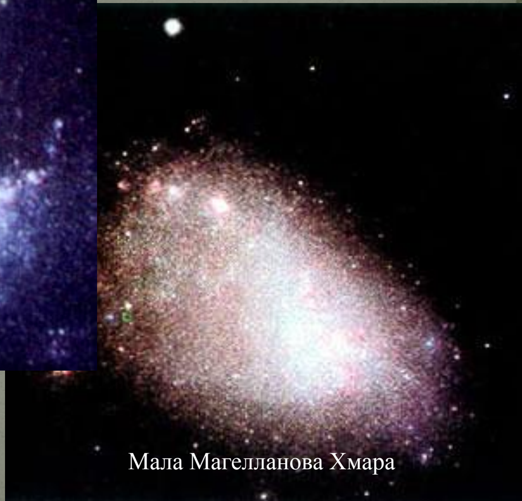
Мала Магелланова Хмара