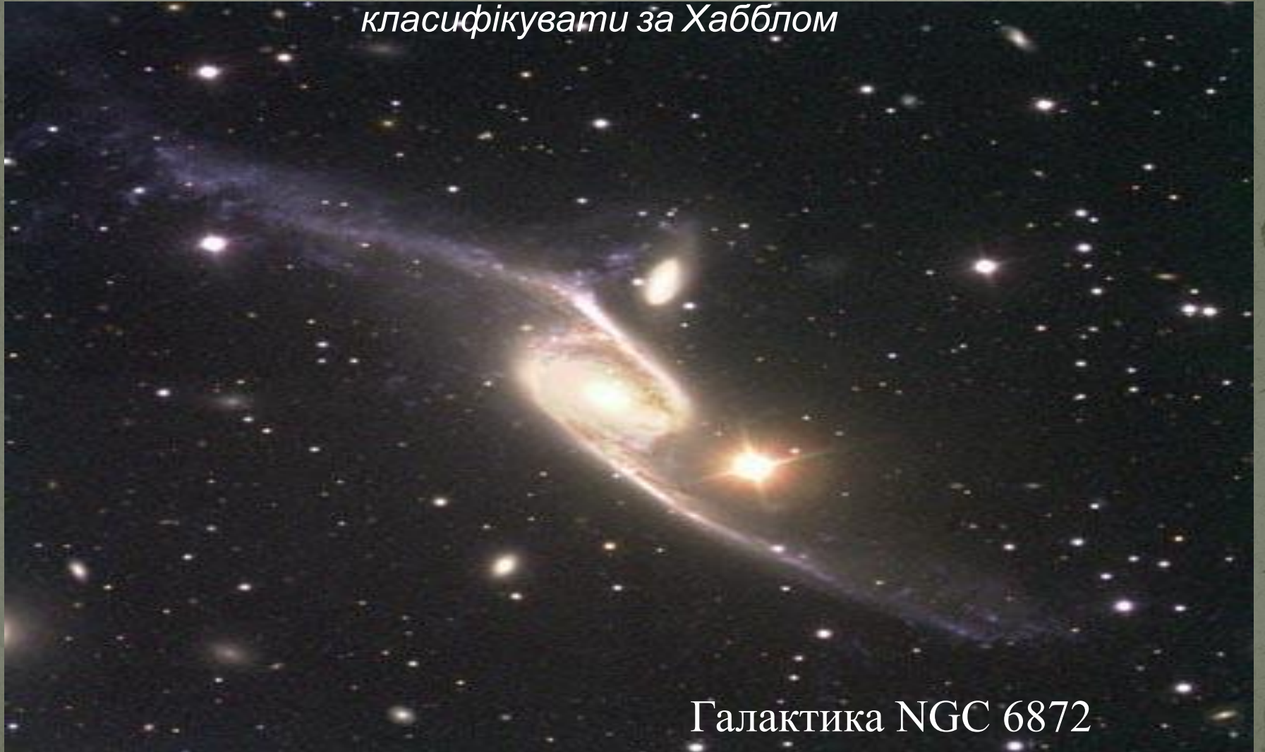
Галактика NGC 6872

У XX столітті великі телескопи виявили, що 5-10% від загального числа галактик мають дуже дивний, спотворений вигляд, так що їх важко класифікувати за Хабблом