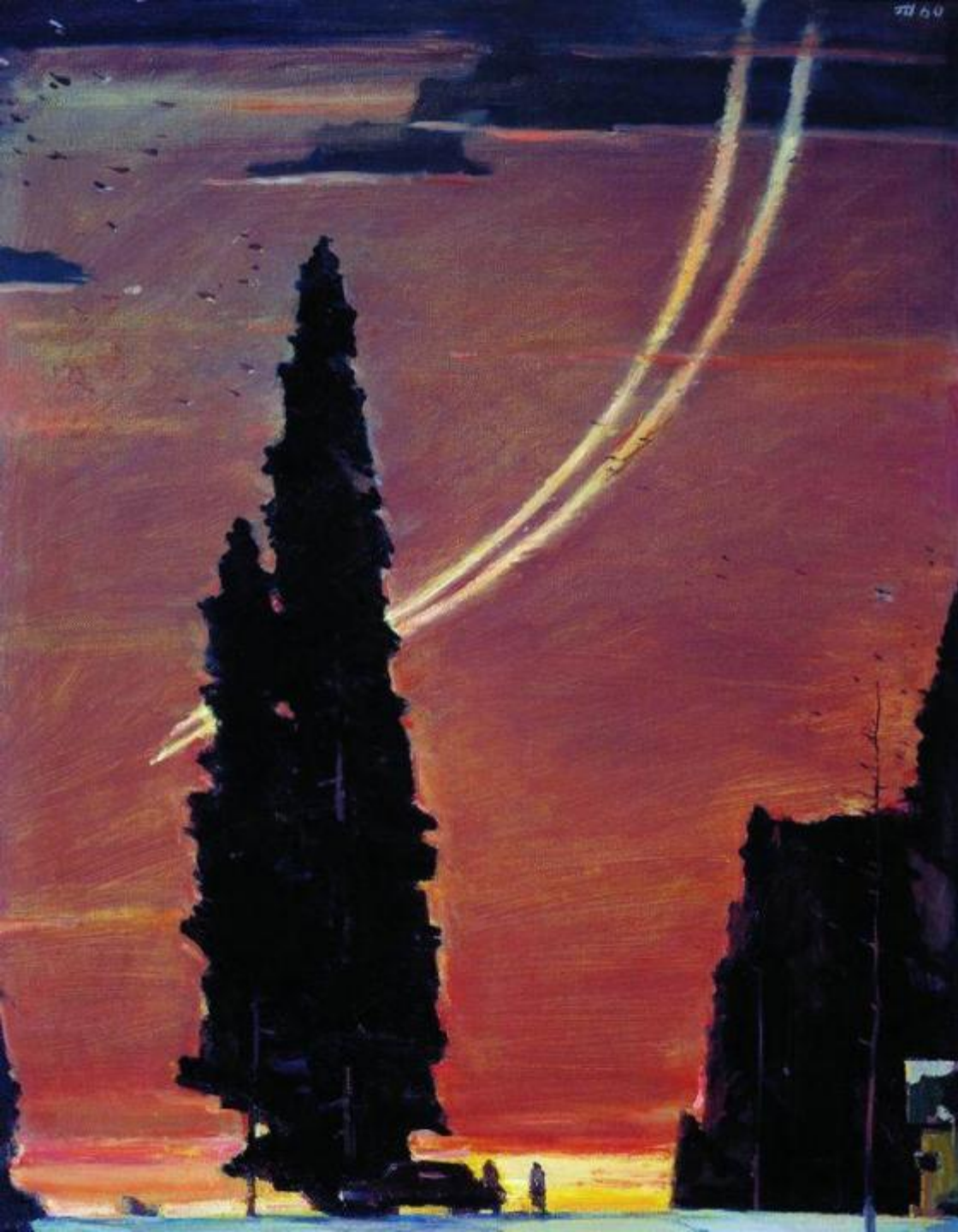
Г.Г. Нисский «Зимний вечер»