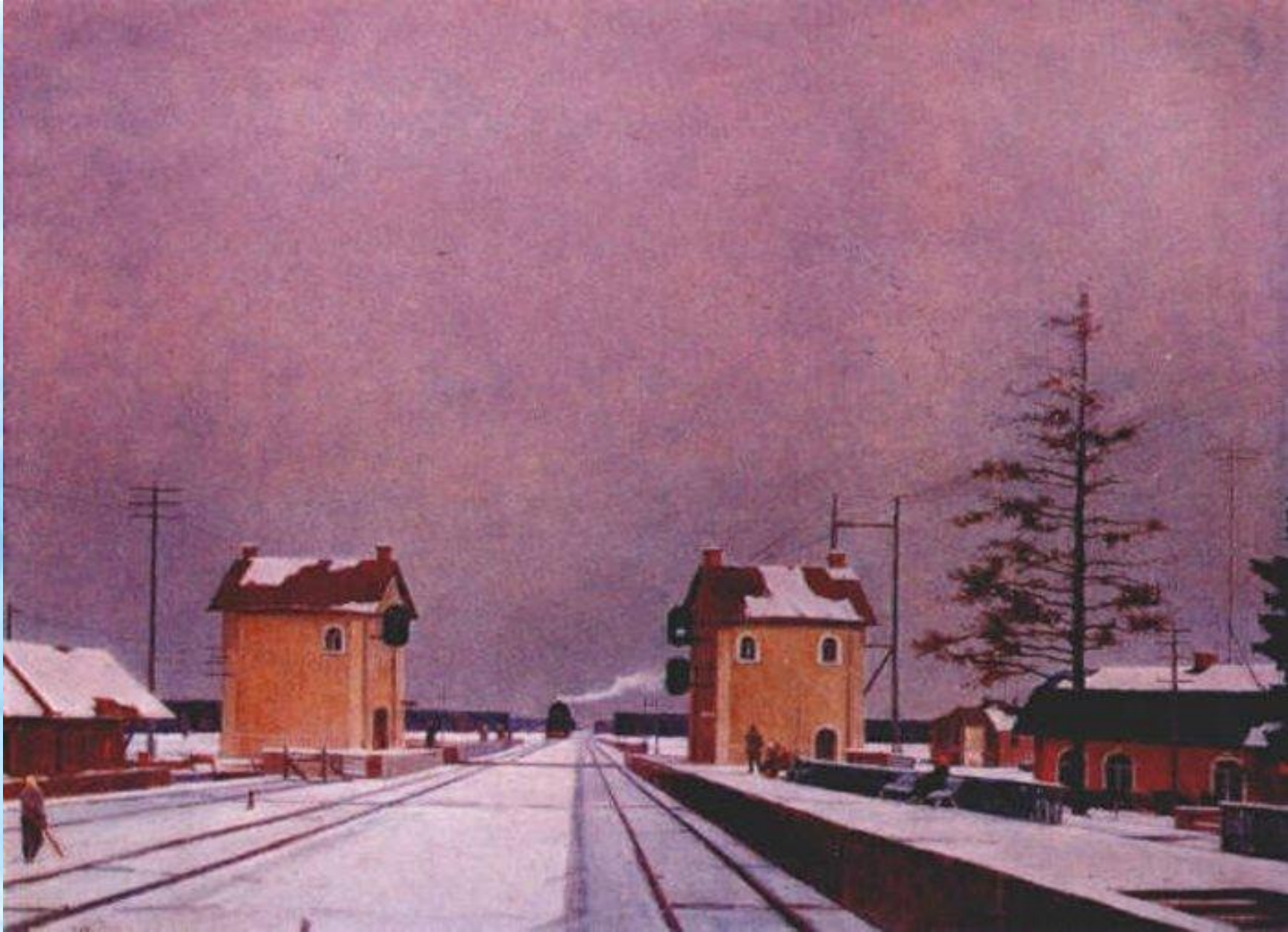
Г.Г. Нисский «Полустанок»