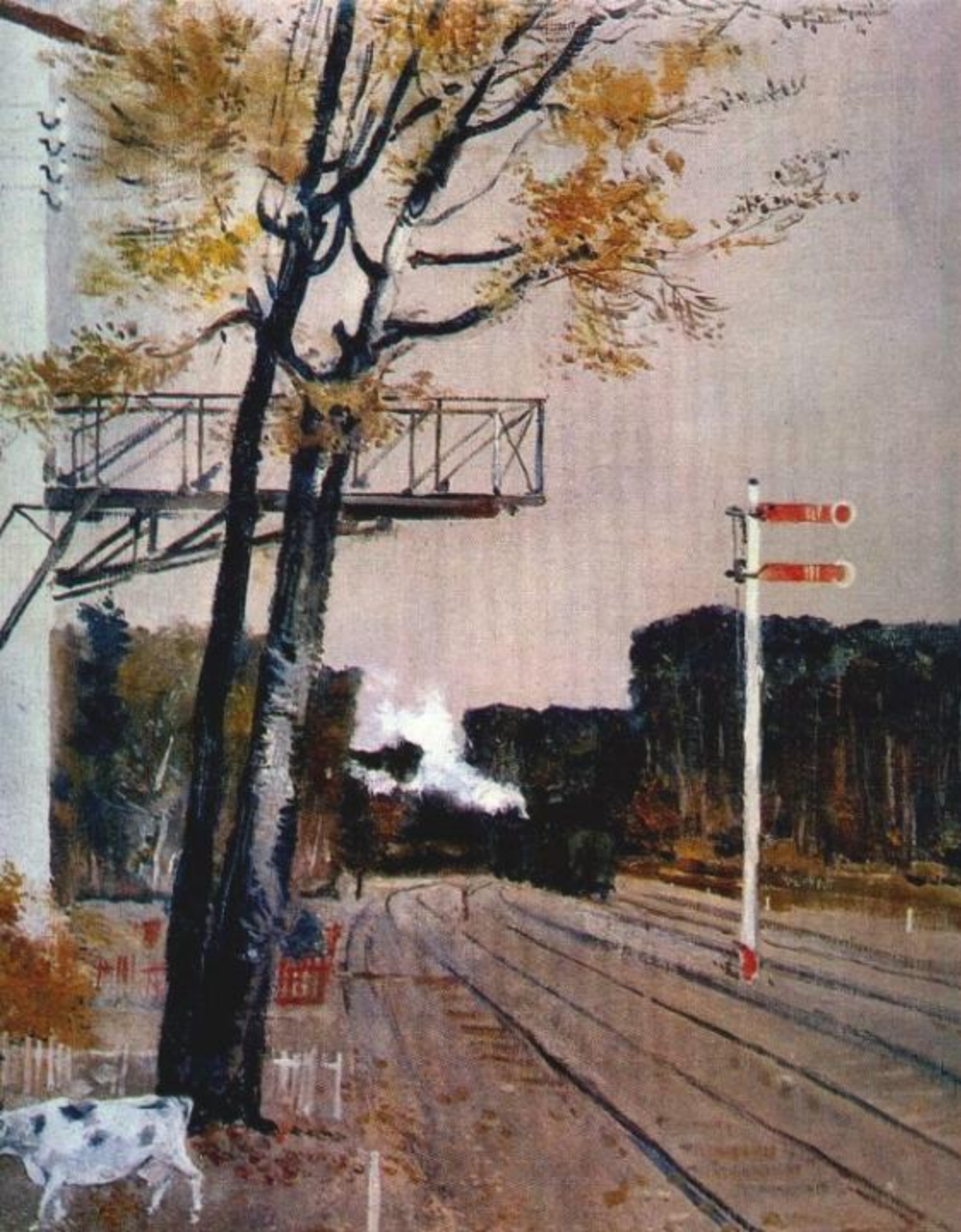
Г.Г. Нисский «Семафоры»