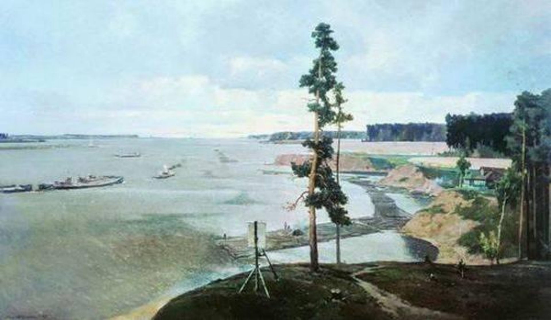
Г.Г. Нисский «Верхняя Волга»