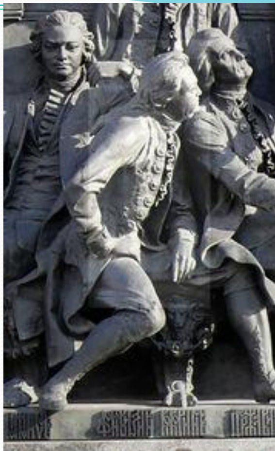
Денис Иванович Фонвизин . Памятник 1000-летия России в Великом Новгороде