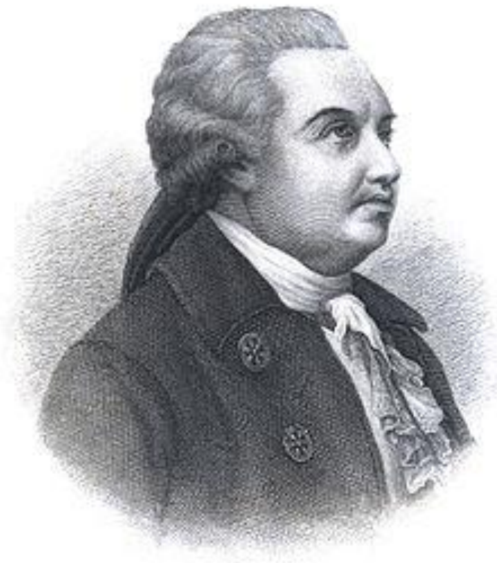
Денис Иванович Фонвизин 3 (14) апреля 1745- 1(12) декабря 1792