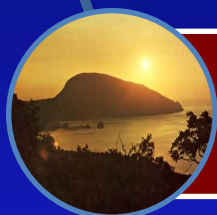
Фото Квест тур