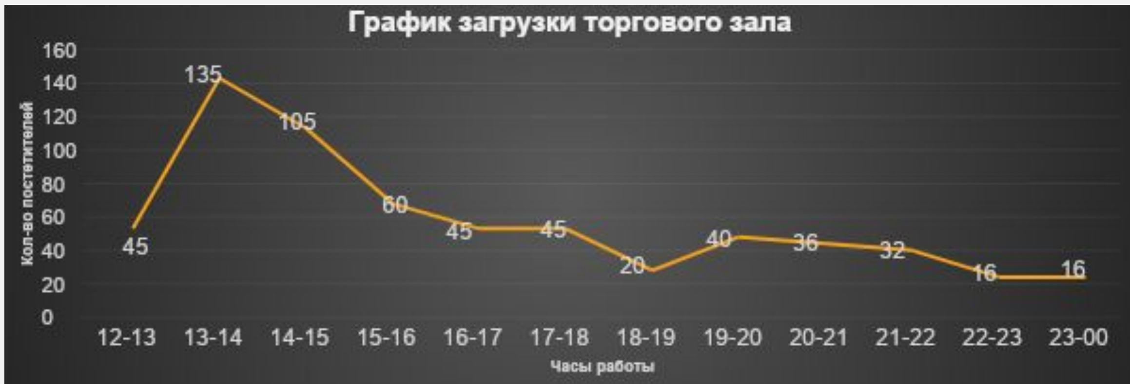
ГРАФИК ЗАГРУЗКИ ЗАЛА ПО ЧАСАМ