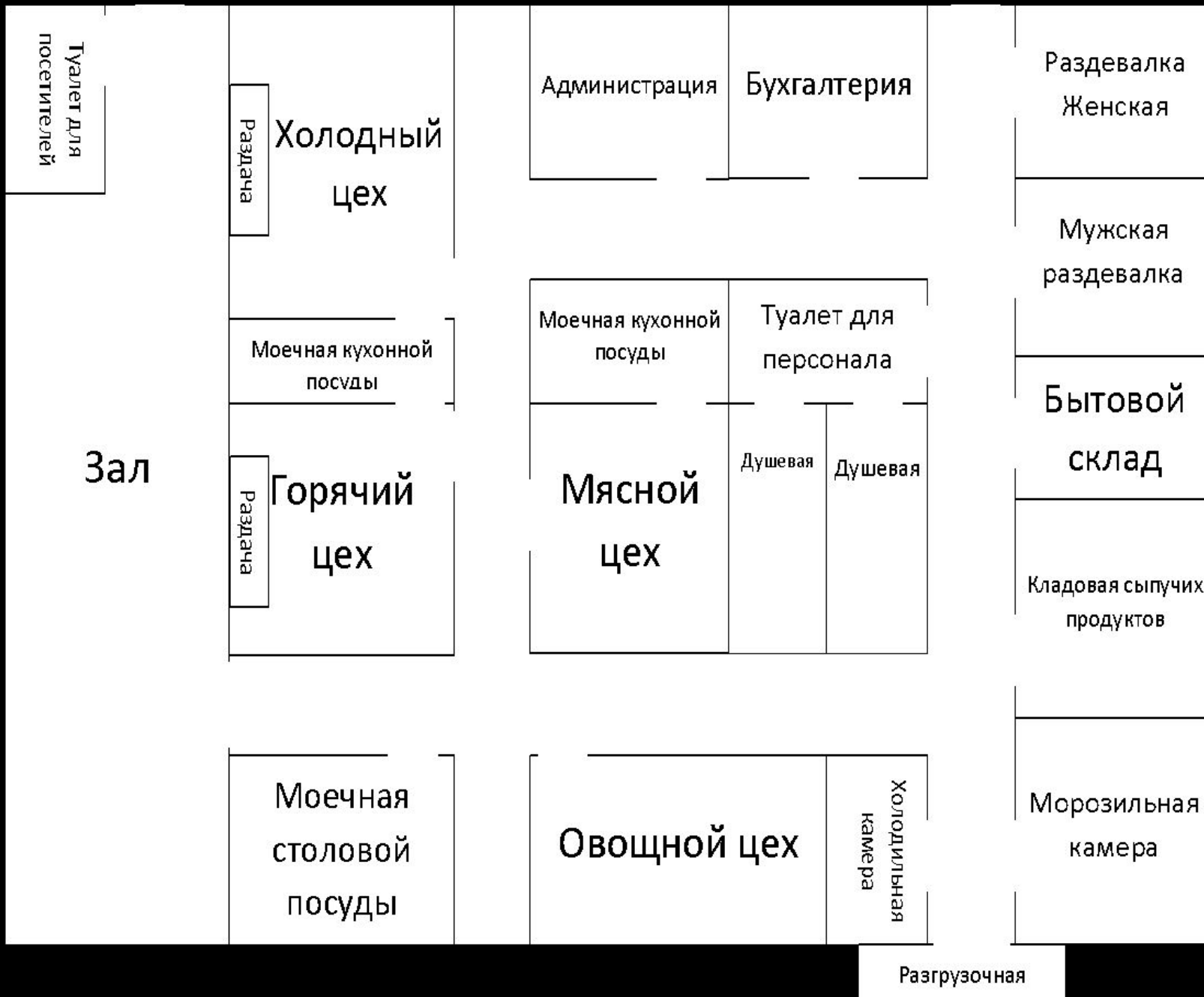
СХЕМА РЕСТОРАНА I ГО КЛАССА «ТРАДИЦИЯ»