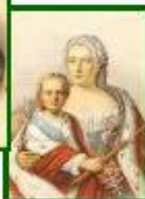
Иван VI Антонович и Анна Леопольдовна 1740-1741