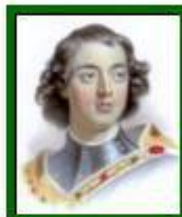
Петр I 1682-1725

Период в истории России с 1725 по 1762 гг.