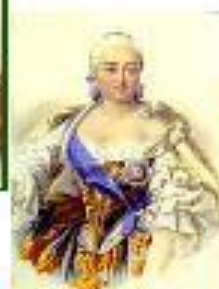
Елизавета Петровна 1741-1761