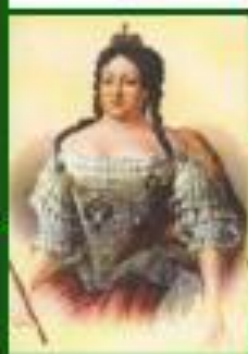
Анна Иоанновна 1730-1740