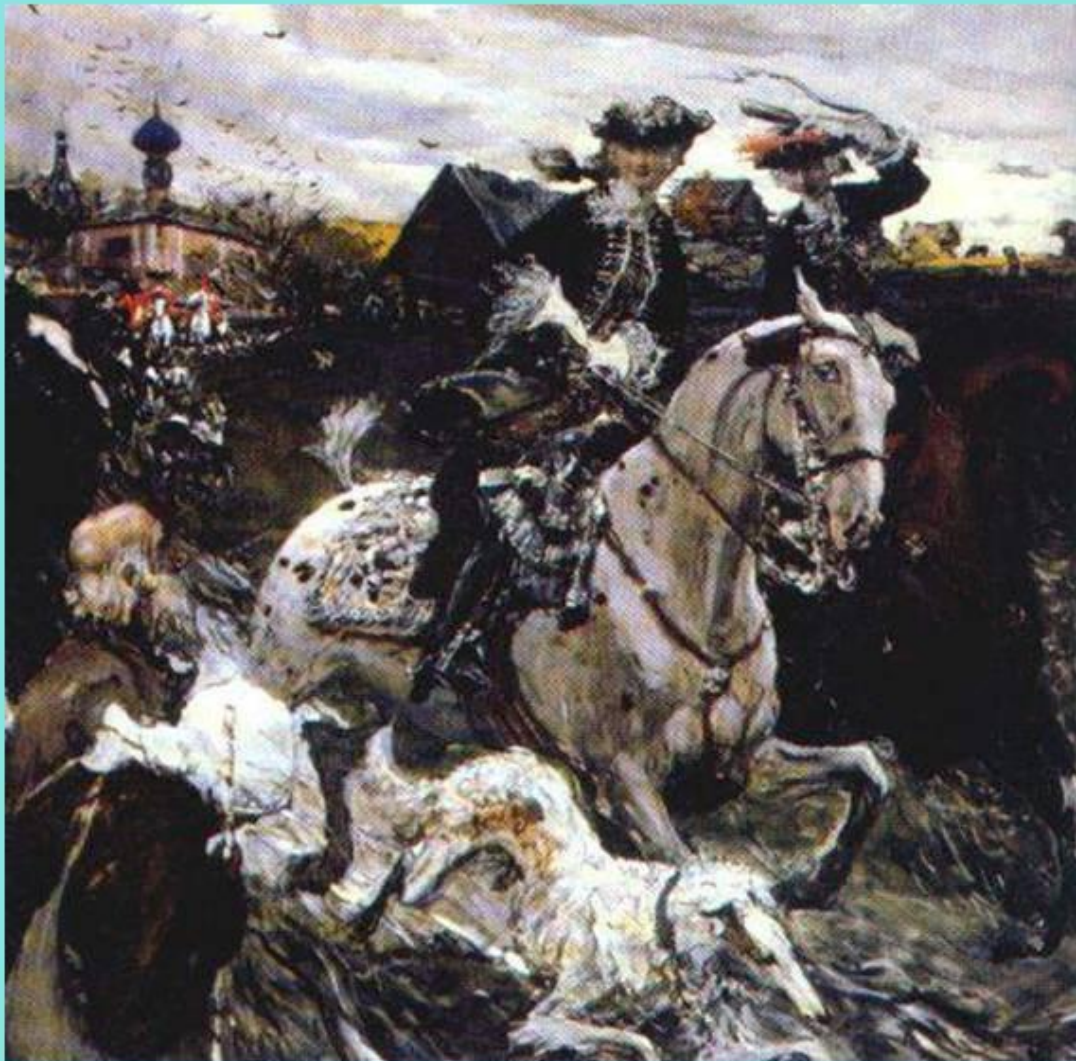
В.Серов. Петр II и цесаревна Елизавета на псовой охоте.