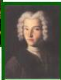
Петр II 1727-1730