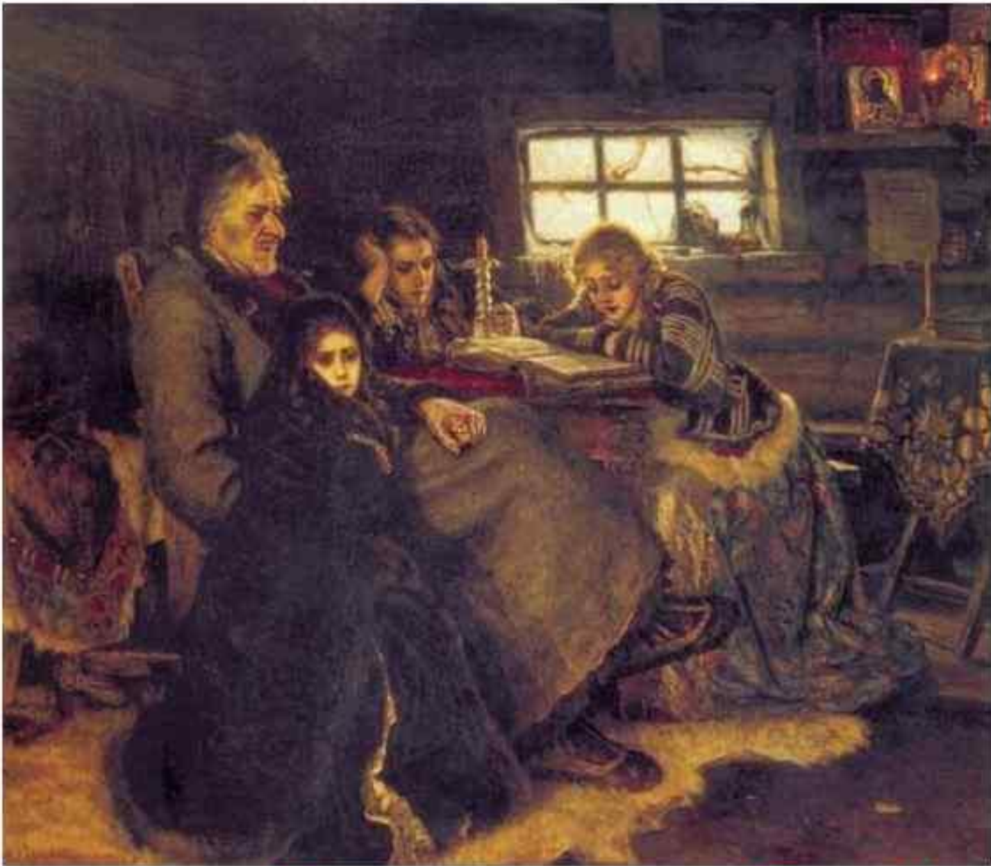
Суриков: Меншиков в Берёзове