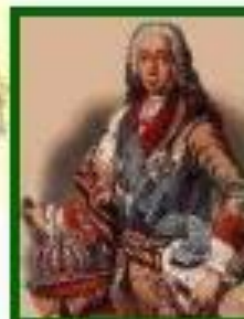
Петр III 1761-1762