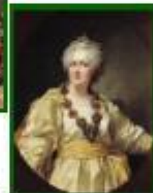
Екатерина II 1762-1796