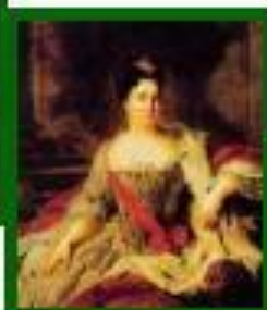
Екатерина I 1725-1727