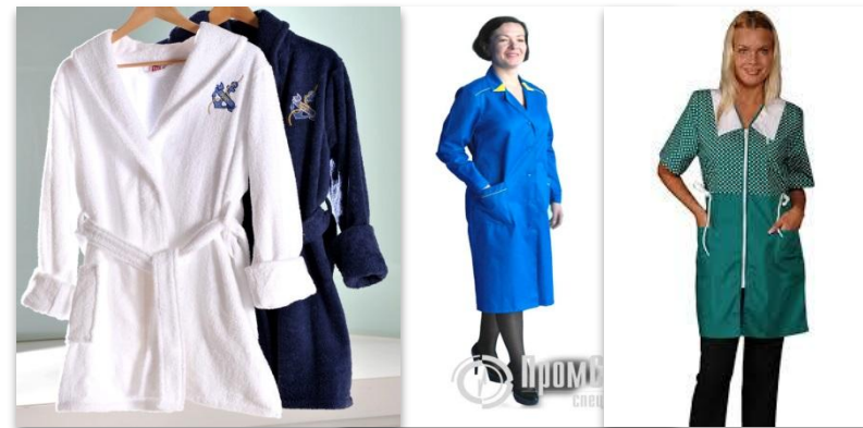
1 • класичний