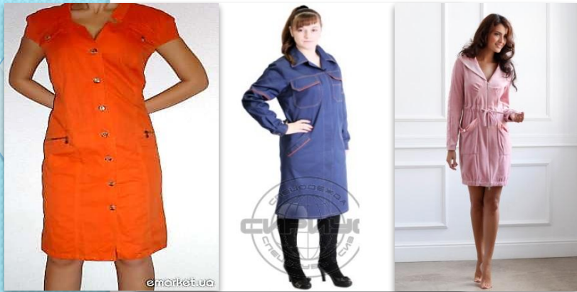
2 • спортивний