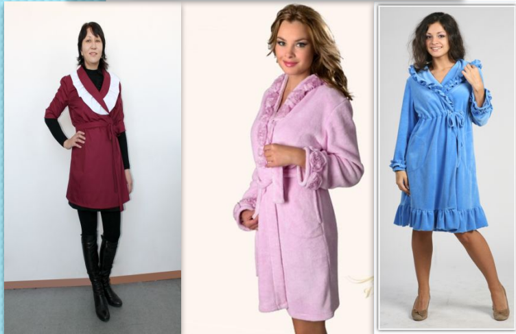
3 • романтичний