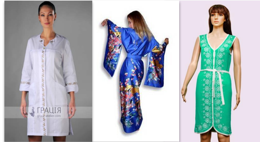
4 • фольклорний