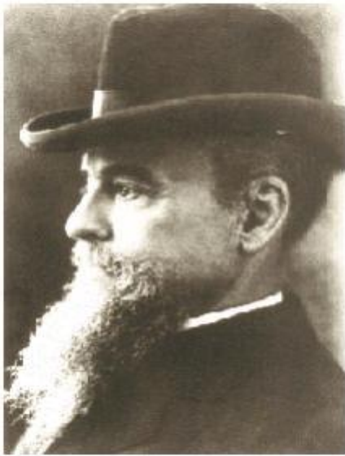
Парето Вильфредо (1848-1923), итальянский экономист и социолог.