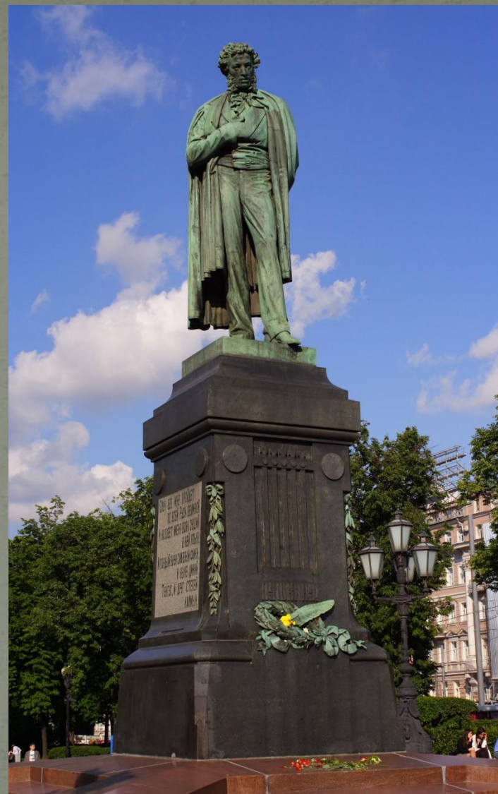
Памятник А.С.Пушкину (1880г)

Творчество А.М. Опекушина связано с развитием монументальной скульптуры. Он является создателем памятника А.С. Пушкину, открытого в Москве в 1880 г. и созданного на добровольные пожертвования.