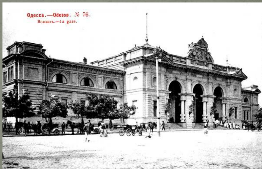
Вокзала в Одессе