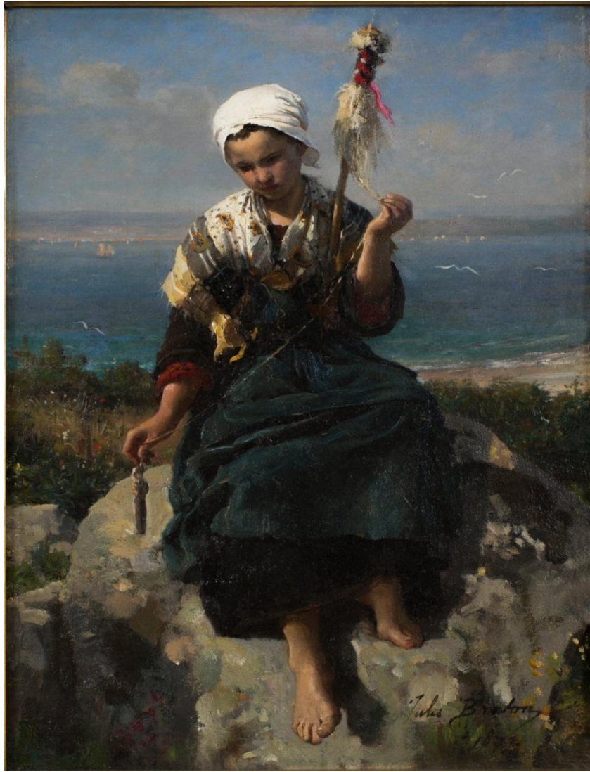
Жюль Бретон «Пряха».