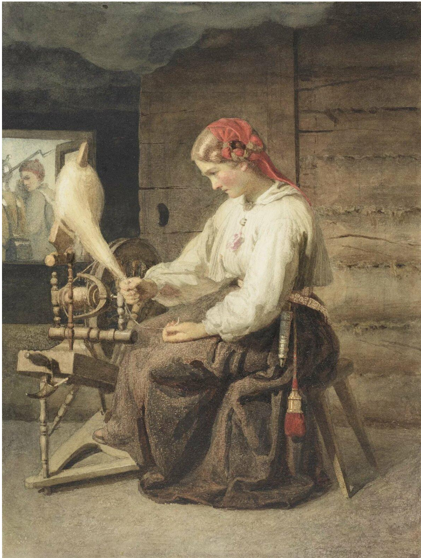
Йохан Келер «Пряха» (Оборванная нить).

Жители Эллады же считали веретено осью мира, которая была в руках Ананке – божества судьбы, предопределенности каждого течения жизни. Об это рассказывает Платон в труде «Государство». Он считает все мироустройство результатом деятельности Ананке. В работе ей помогают сирены, которые время от времени раскручивают веретено, создавая инерцию.