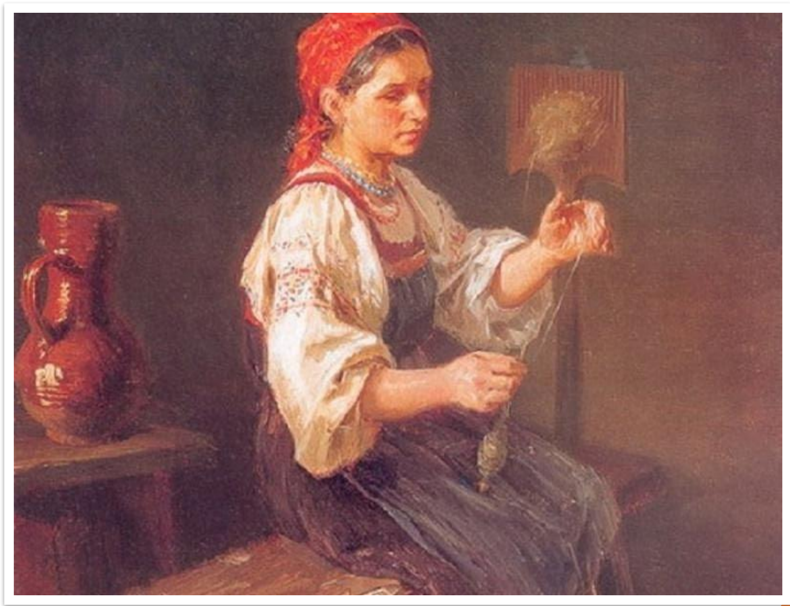
И.М. Пряников «Пряха». 1878 г.