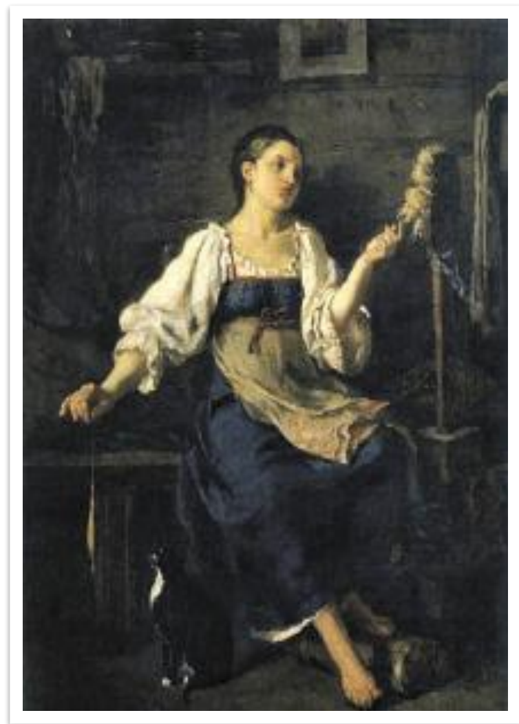
Ф.С. Журавлев «Пряха».

Постоянное многолетнее вращение на месте включало веретено в мировую систему полей, заряжало энергией метафизических миров.