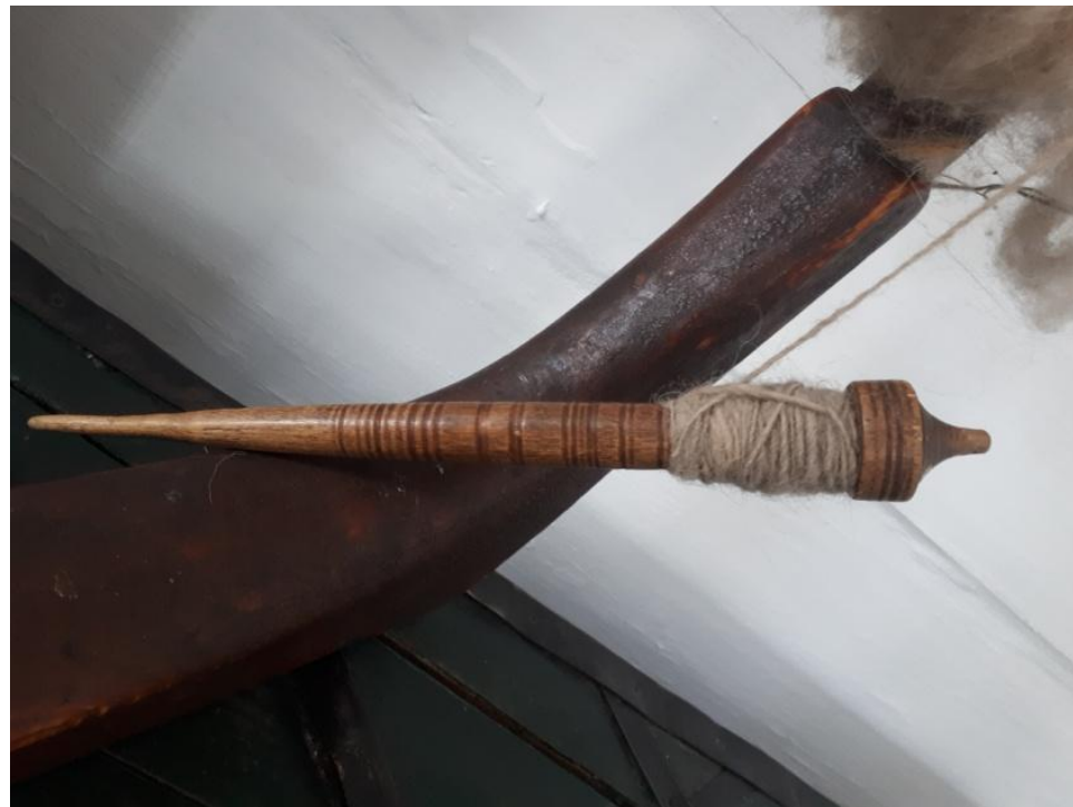
Веретено. Начало XX века. Дерево, токарная обработка. 27 см.