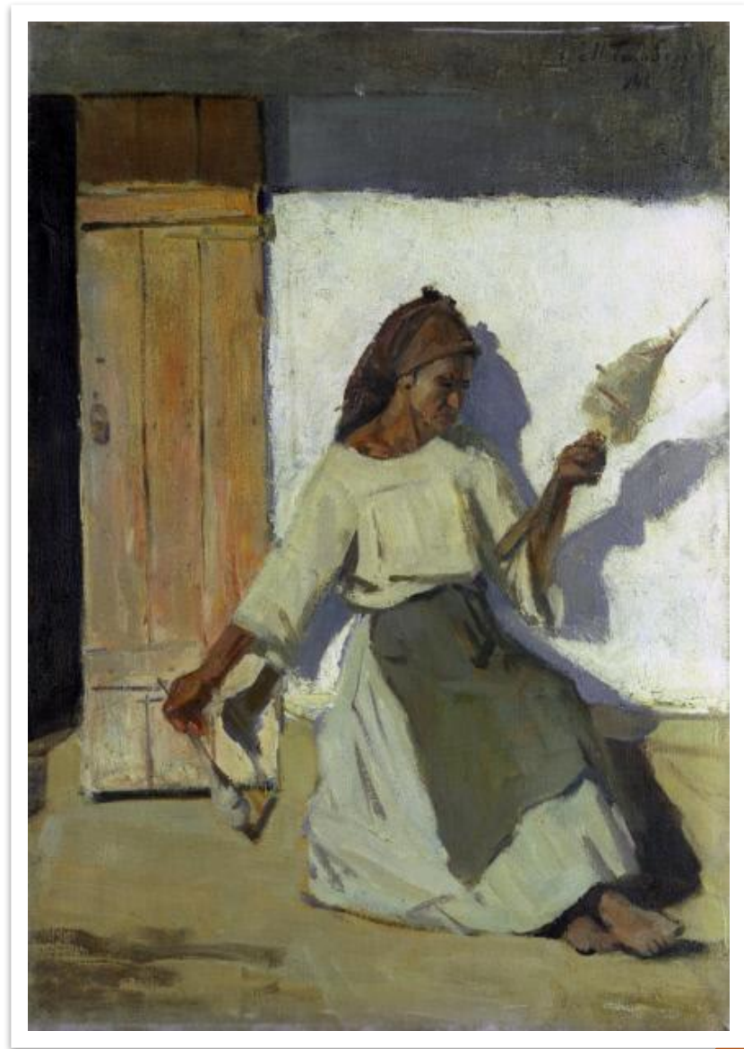
А.Г. Венецианов «Пряха».

Нередко оно выступает в качестве принадлежности многих женщин из мифологии. Почти все женские божества так или иначе связаны с ним. С его помощью вершатся судьбы, обрезаются или добавляются человеческие жизни.