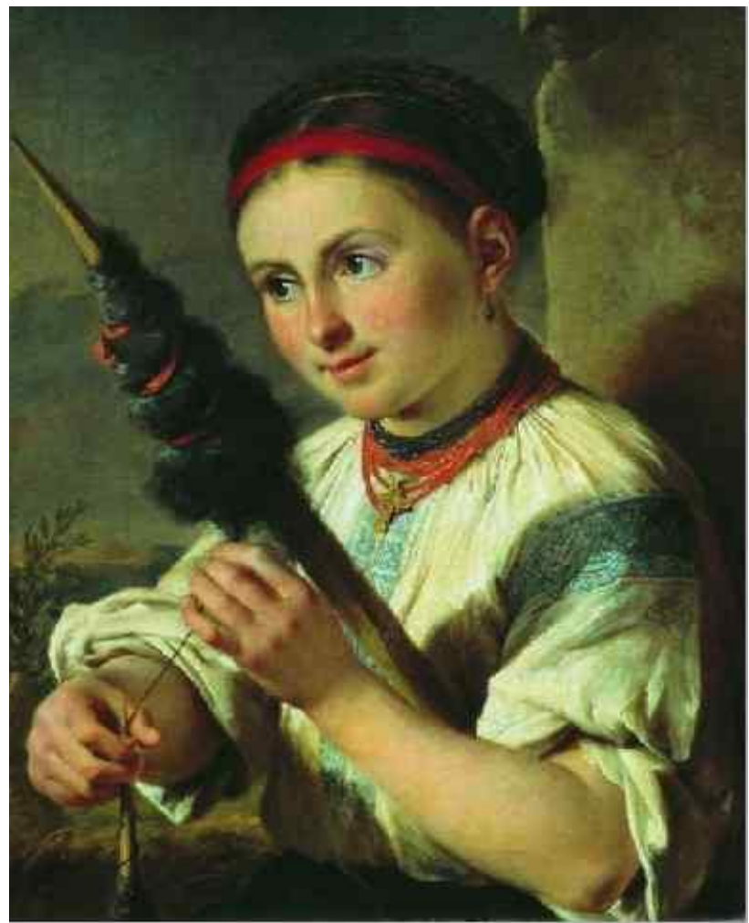
В. Тропинин «Пряха». 1821 г.