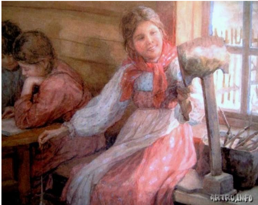
Ф.С. Сычков «Пряха».