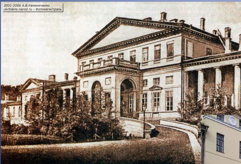
Первое здание Института Корпуса инженеров путей сообщения.