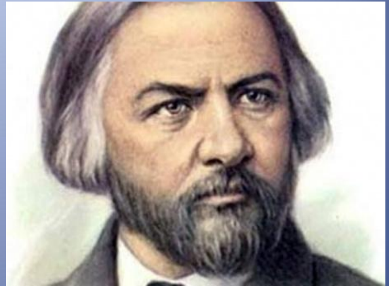
Среди выпускников М.И. Глинка