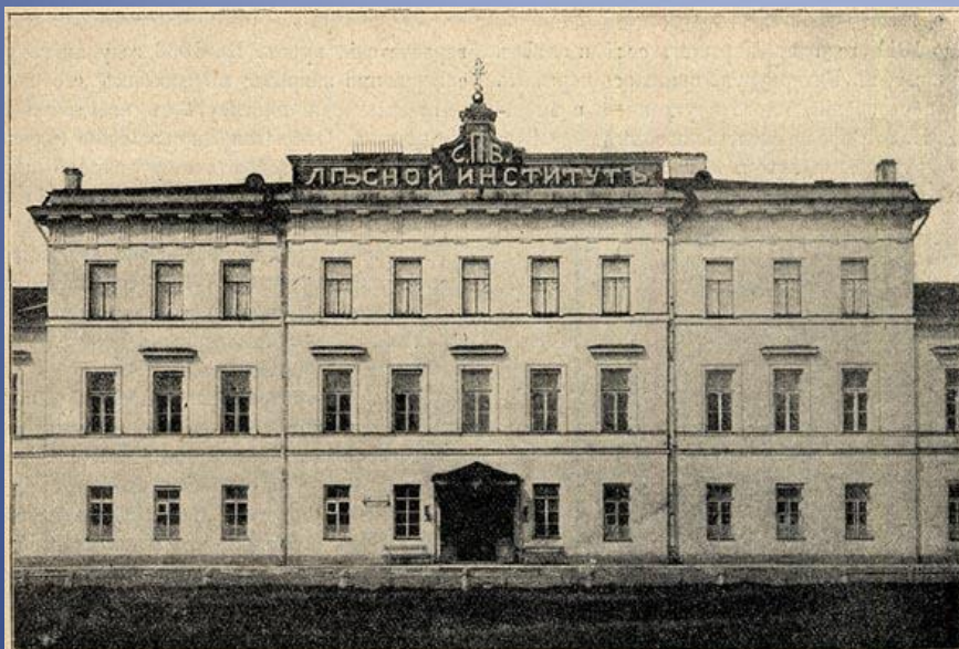
ГЛАВНЫЙ ФАСАДЪ С.-ПЕТЕРБУРГСКАГО ЛЕСНОГО ИНСТИТУТА.