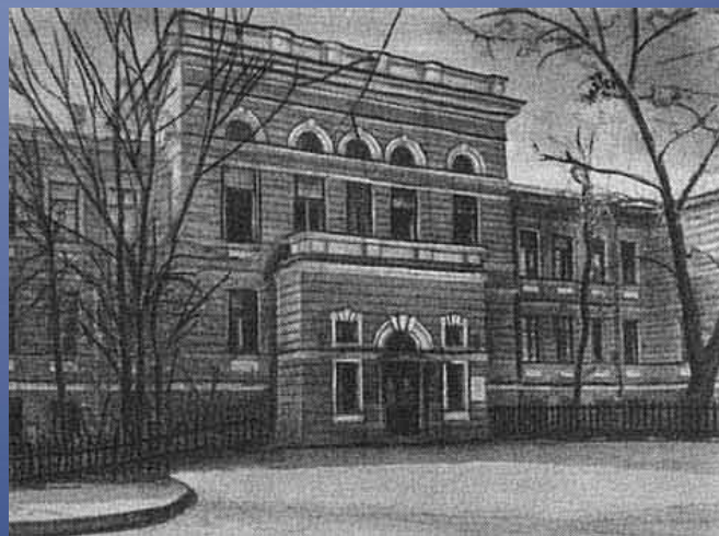
Академия Императорская Медико-хирургическая (Военно-Медицинская).