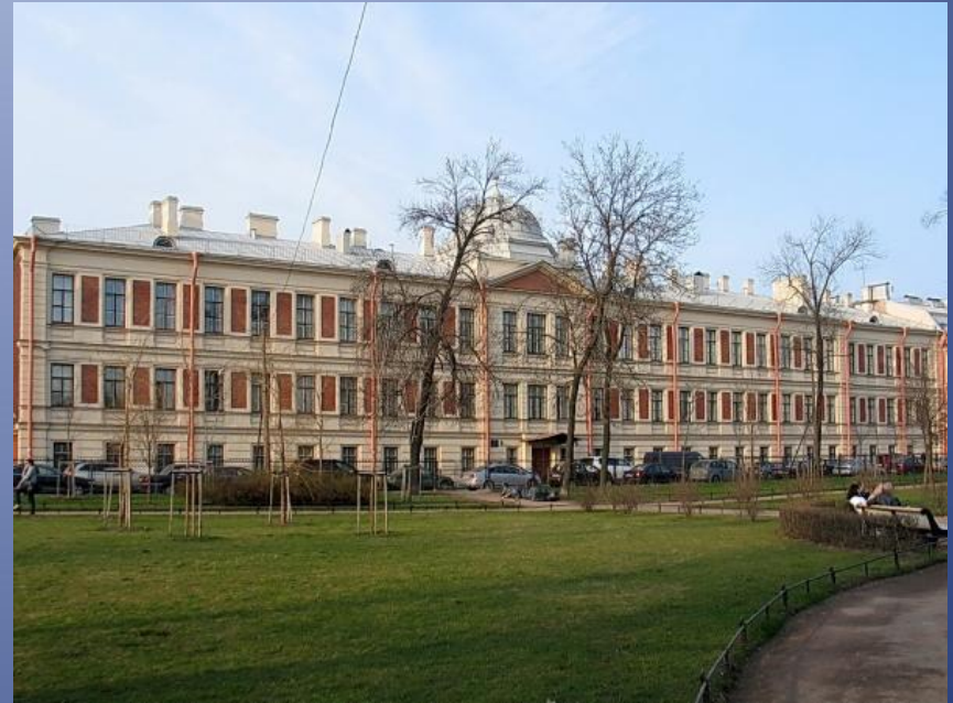
Блохинад.31. Еленинское училище