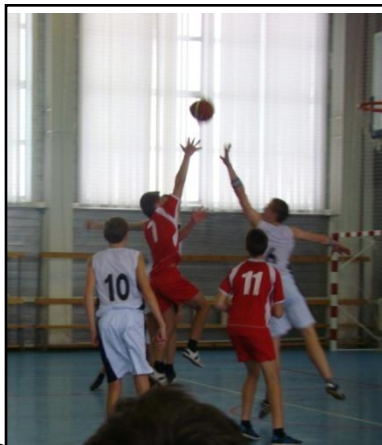
Фрагменты игры с ординцами