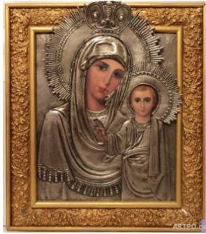
Икона Казанской Божьей Матери

22 октября 1612 года бойцы народного ополчения под предводительством Кузьмы Минина и Дмитрия Пожарского штурмом взяли Китай-город , гарнизон Речи Посполитой отступил в Кремль . Князь Пожарский вступил в Китай-город с Казанской иконой Божьей Матери , которую ему прислал патриарх Филарет. 26 октября ( 5 ноября по новому стилю) командование поляков подписало капитуляцию , выпустив тогда же из Кремля московских бояр и других знатных лиц. На следующий день гарнизон сдался. В конце февраля 1613 года Земский собор избрал новым царём Михаила Романова , первого правителя из династии Романовых .