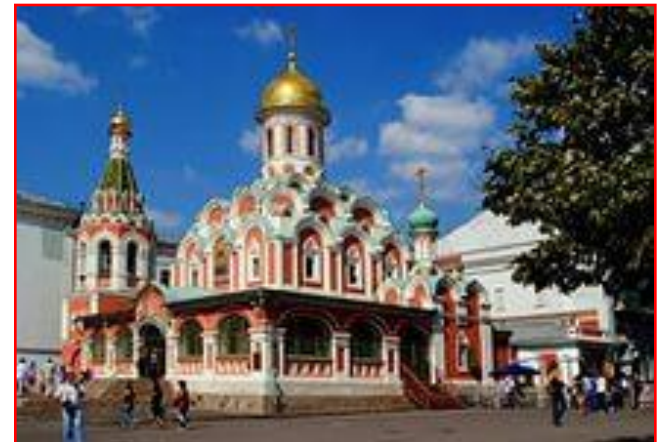
Казанский собор в Москве