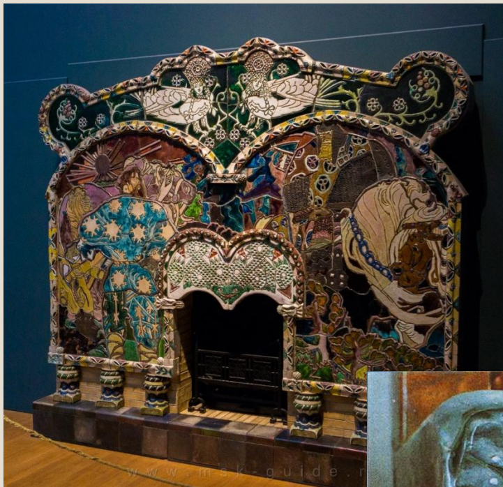
Камин «Микула Селянинович и Вольга»