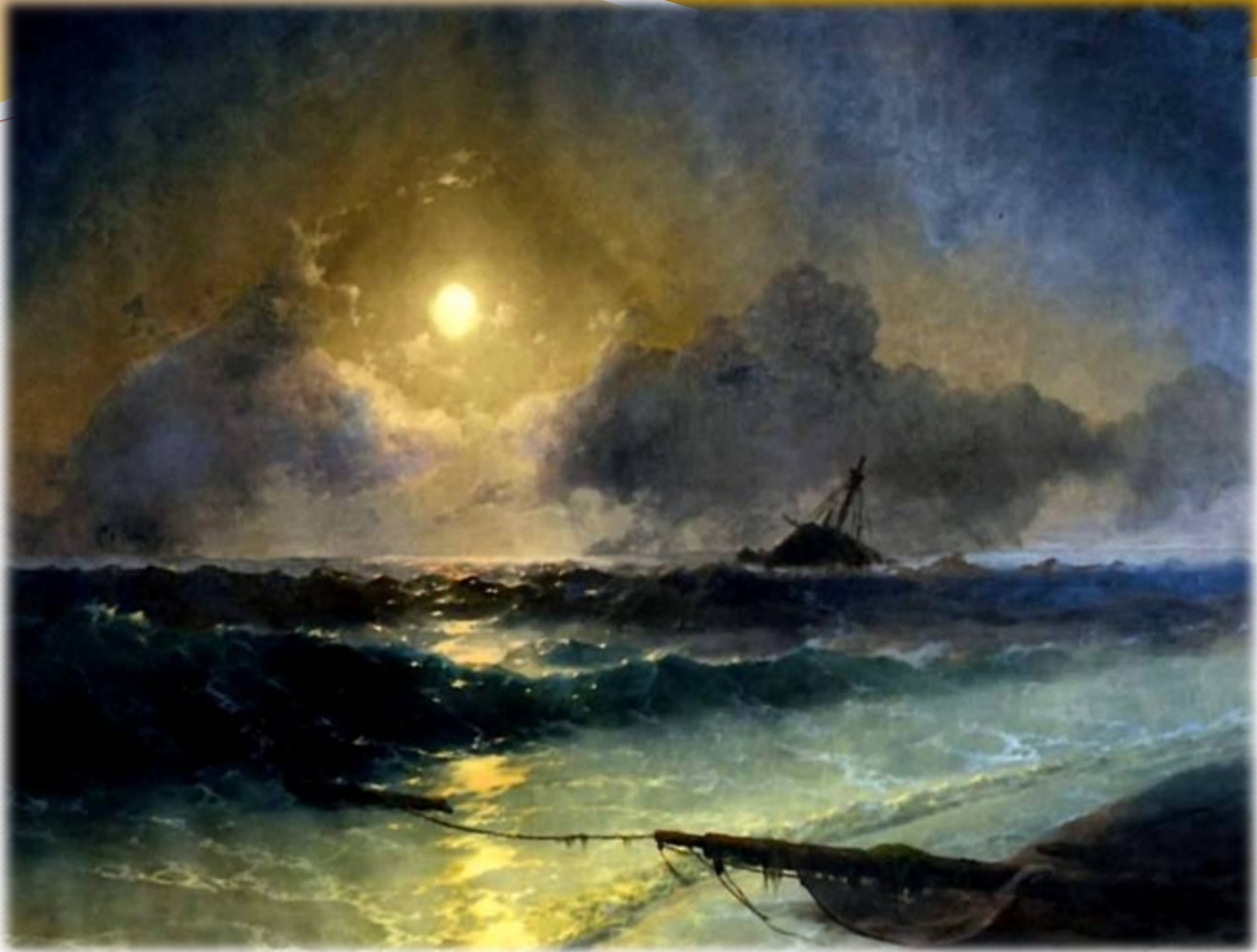
И.К. Айвазовский «Кораблекрушение»