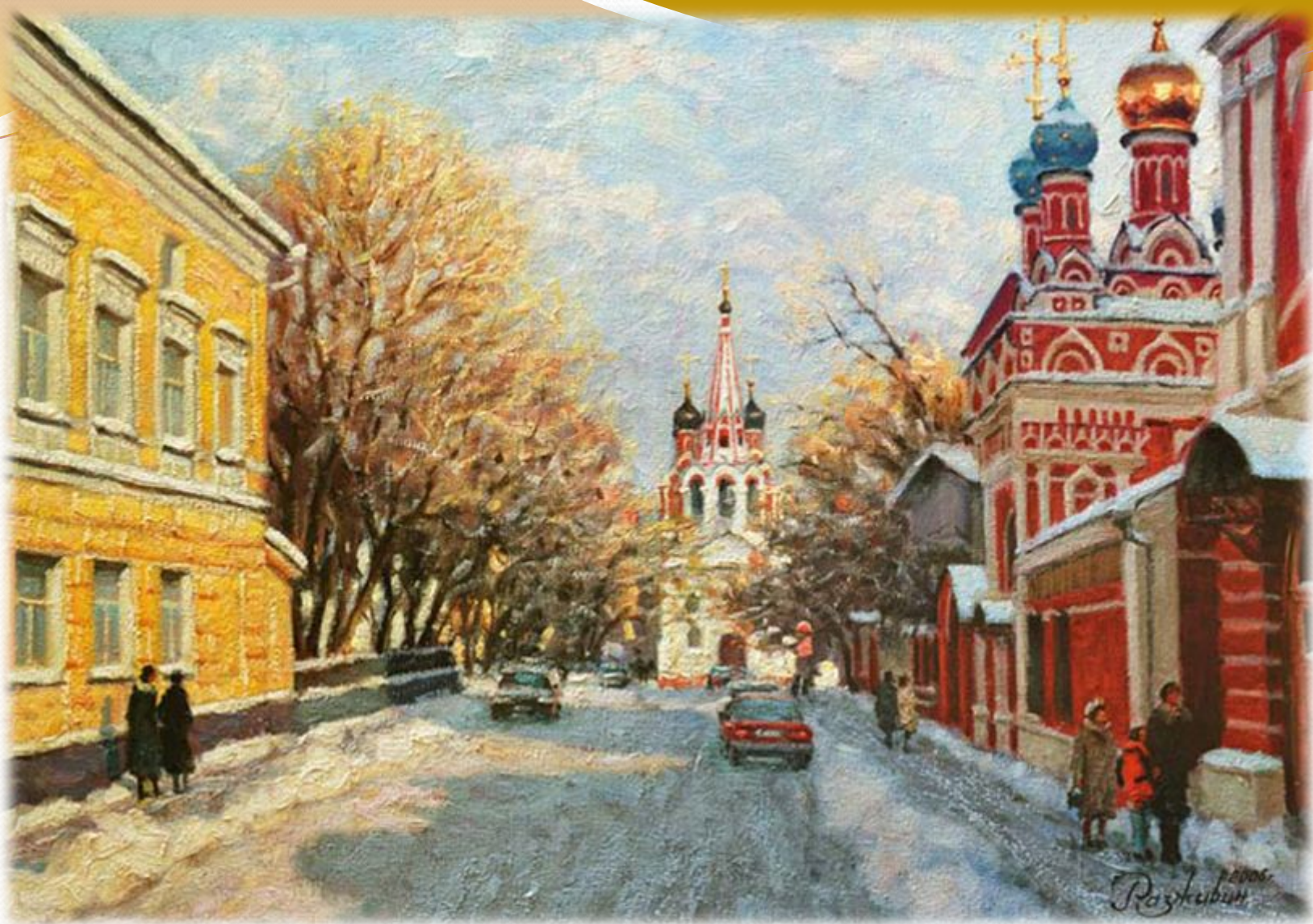
И. РАЗЖИВИН «ПРОУЛОК»