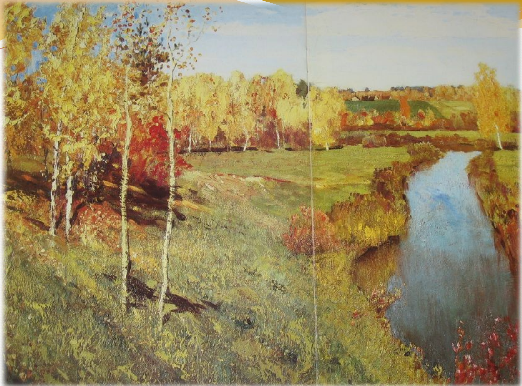
И. ЛЕВИТАН. «ЗОЛОТАЯ ОСЕНЬ»