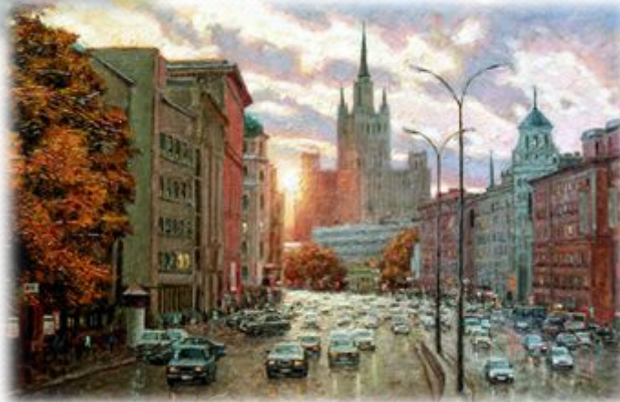
А. Бакеев. Улица.