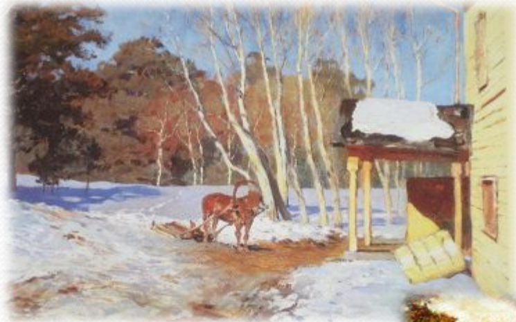
И. Левитан. Март.