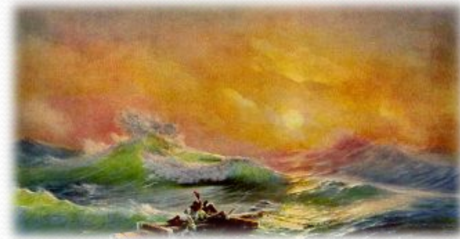
И.Айвазовский . Девятый вал