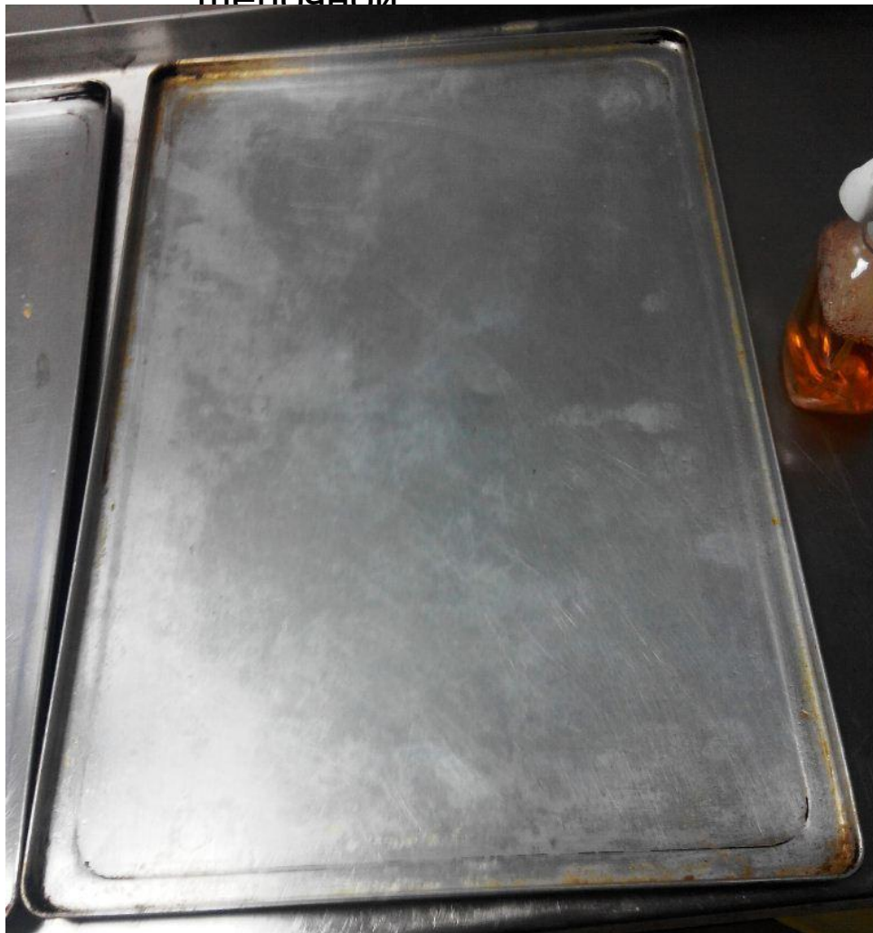
Гриль без щелочи