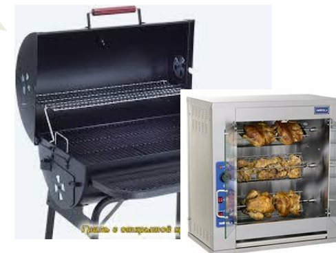
Барбекю и аэрогриль

1:5 1:7 Не вступает в реакцию с металлом и алюминием. Не вызывает ожогов и раздражений на коже. 99% биоразложение. pH 10