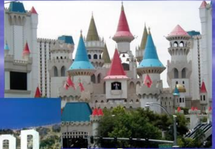
Лас - Вегас