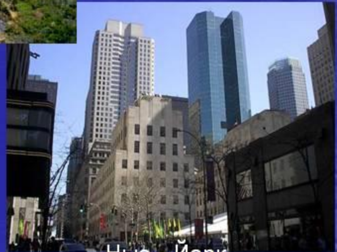
Нью - Йорк