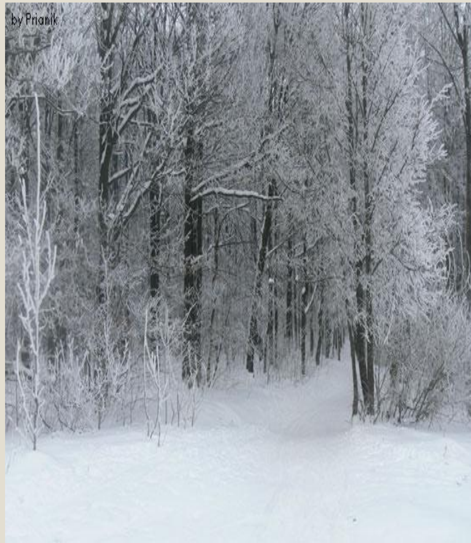
Смешанные и широколиственные леса зимой