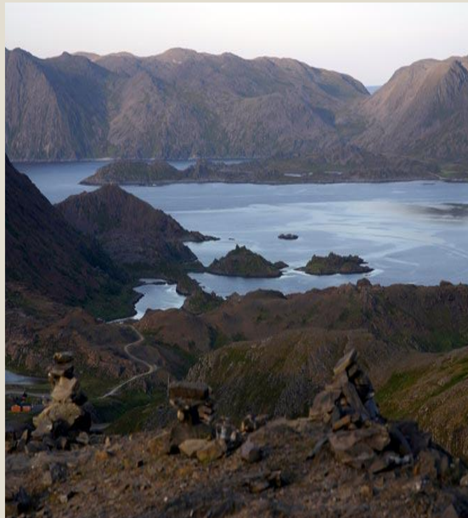
АРКТИЧЕСКАЯ ПУСТЫНЯ ЛЕТОМ