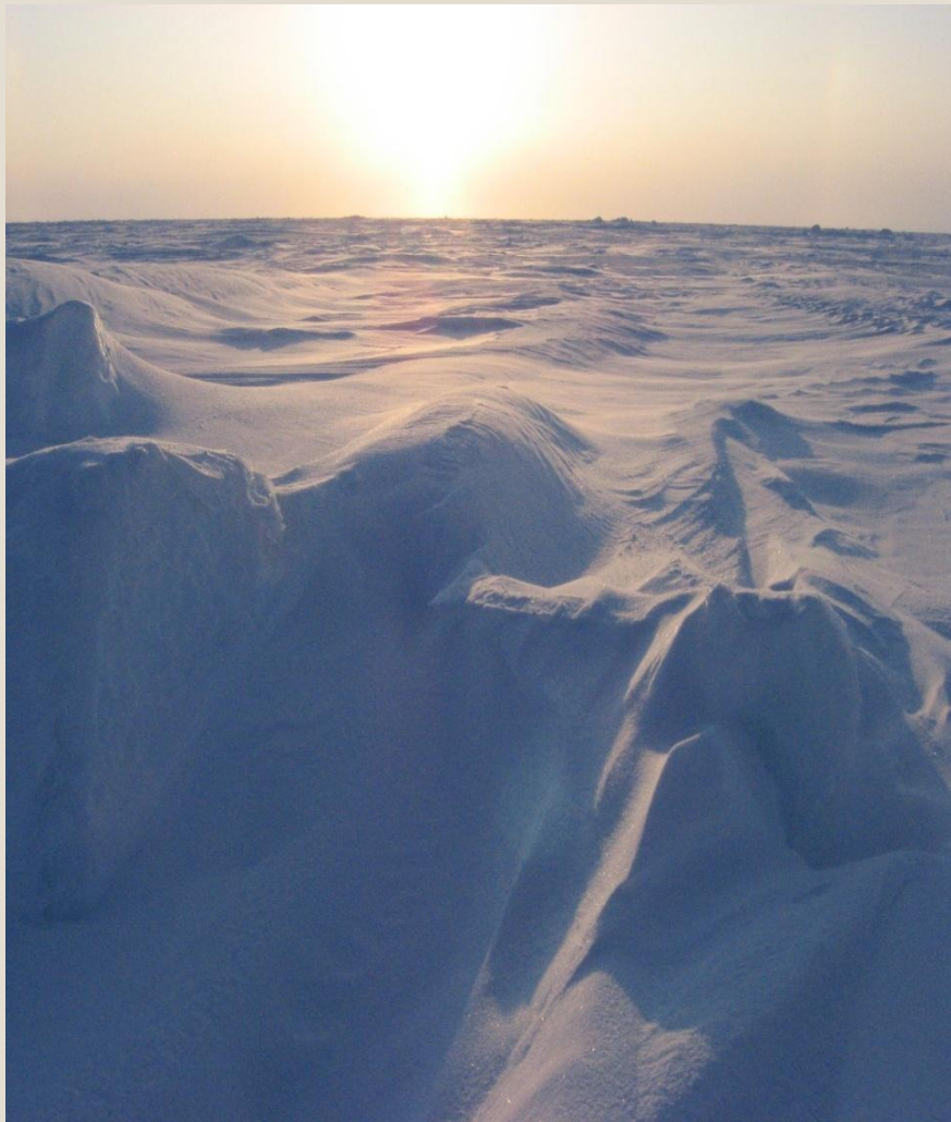
АРКТИЧЕСКАЯ ПУСТЫНЯ ЗИМОЙ