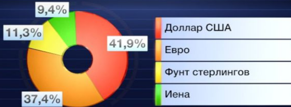
Структура валютной корзины СДР