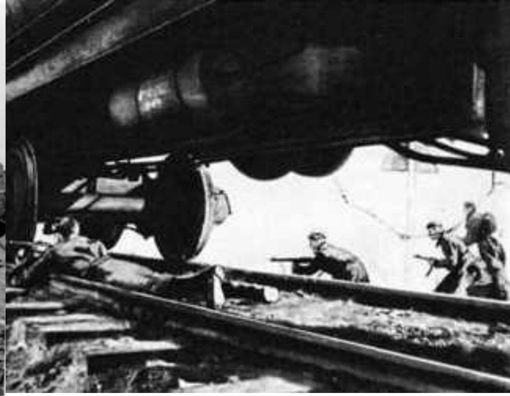
Bundesarchiv, Bild 183-B22703 Foto: Herber | November 1942

Оборонительное сражение под Сталинградом приобретало все более ожесточенный характер. 14 сентября противник прорвался в центр города, завязались бои за железнодорожный вокзал «Сталинград — 1».