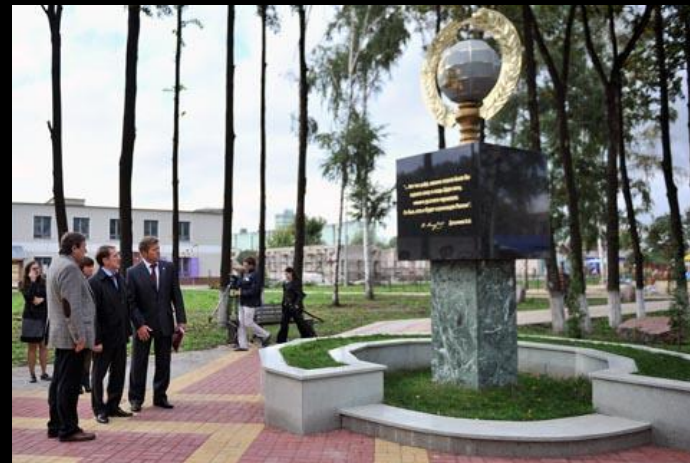
Памятник чернозёму. Посёлок Панино, Воронежская область, 2013 г.