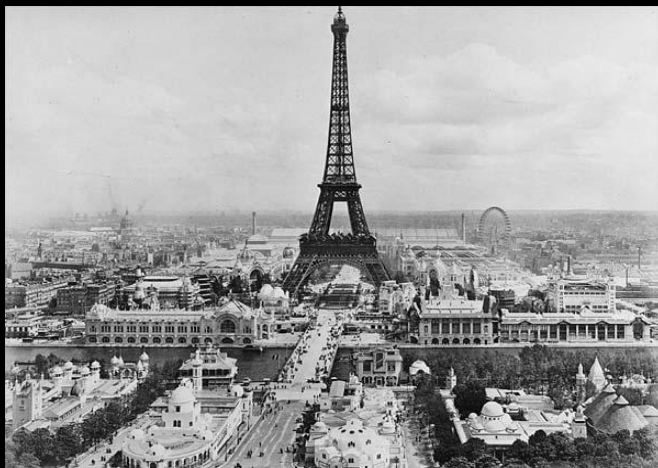
Эйфелева башня – архитектурный символ Всемирной выставки 1889 г.

Уникальный экспонат: куб чернозёма (1 кубическая сажень) из Воронежской губернии – «чёрный бриллиант».