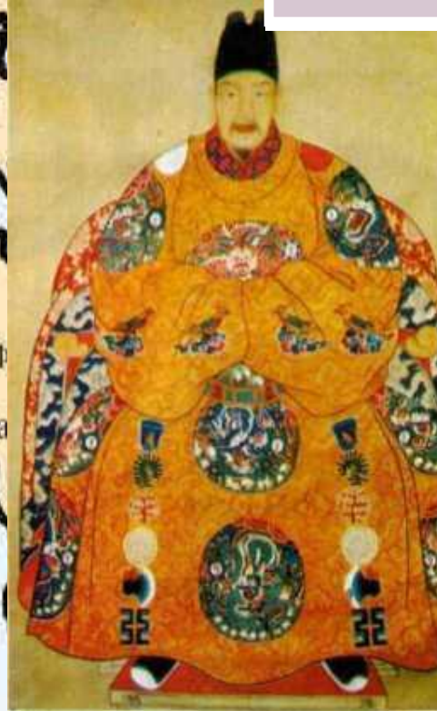
последний император династии МИН