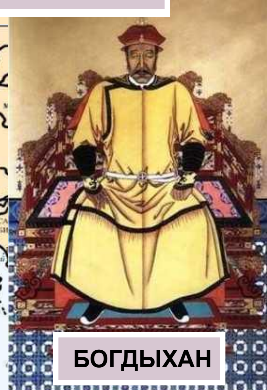
БОГДЫХАН первый император династии ЦИН