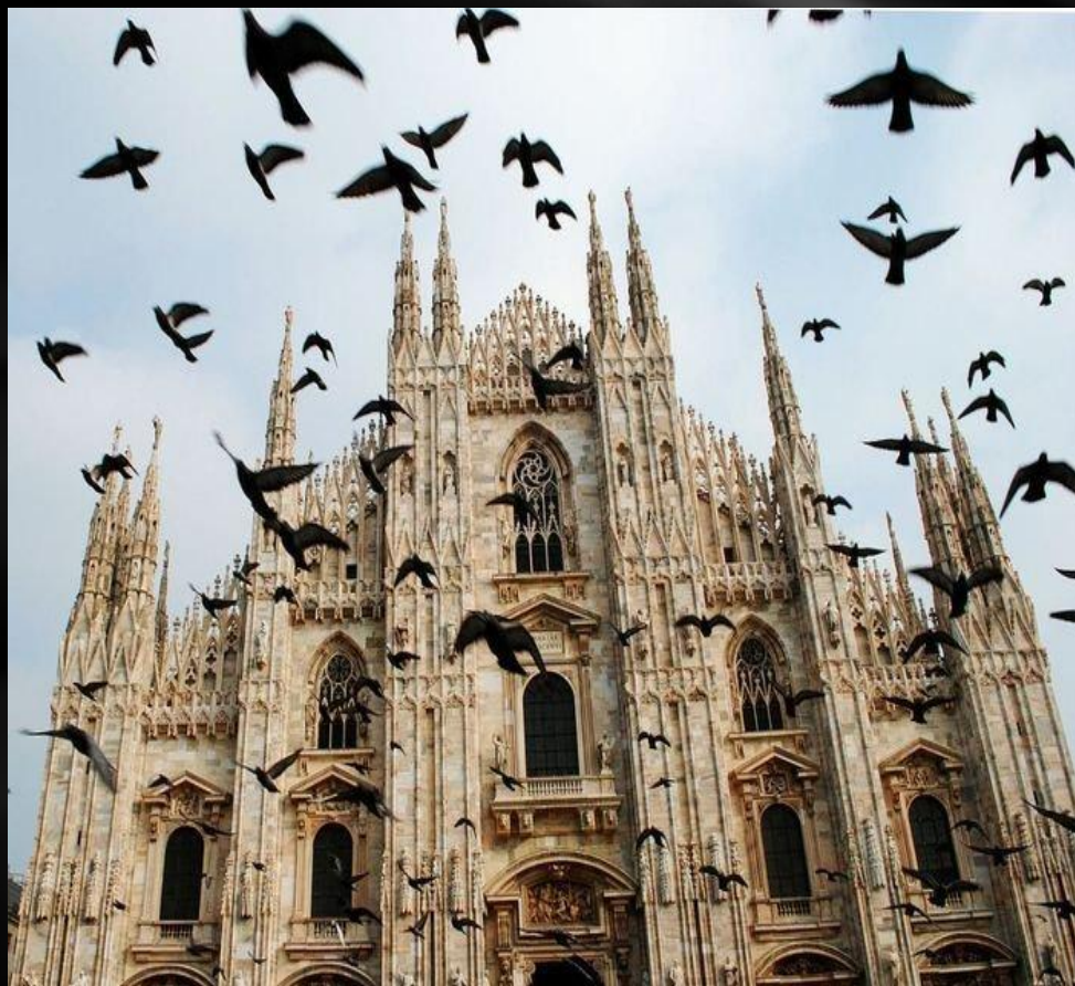
Кафедральний собор у Мілані

На відміну від романського, готичне мистецтво «пропагує» інтерес до людських почуттів, звертається до краси від реального світу, повертається до індивідуальності. Для готичного стилю характерні гострі споруди зі стрілчастими склепіннями, великою кількістю кам'яного різьблення і скульптурних прикрас.