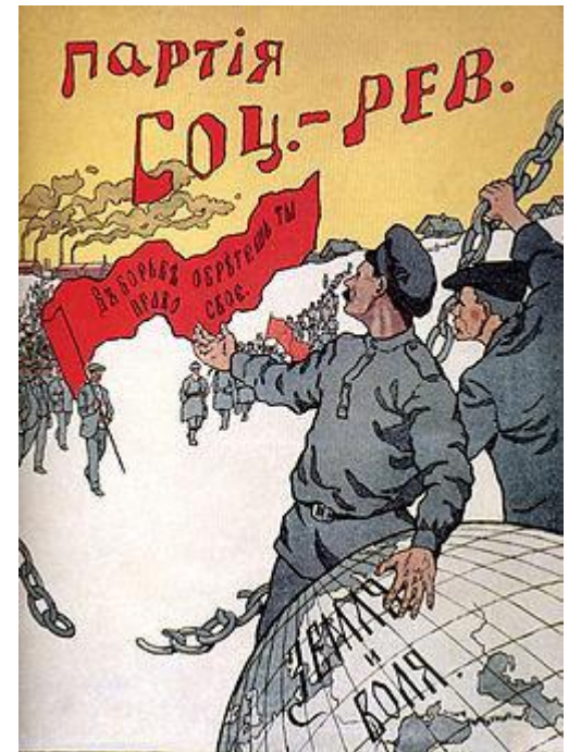
Предвыборный плакат партии в 1917