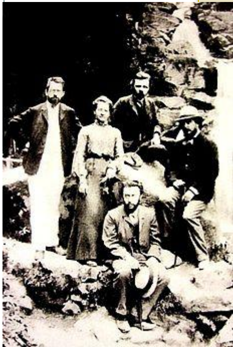
Группа основателей «Союза освобождения»