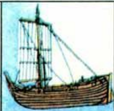
Мореходное русское судно