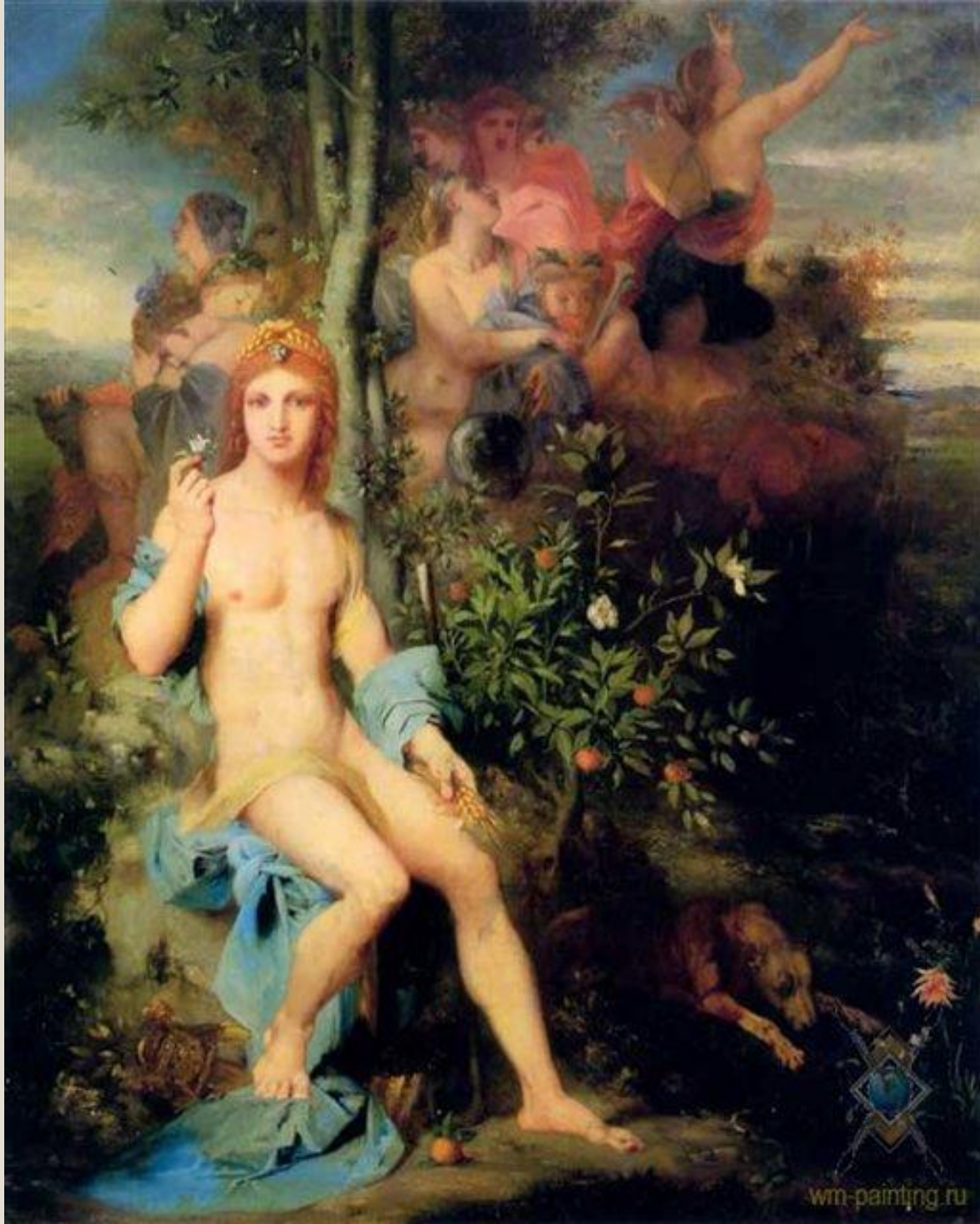
Аполлон и девять муз; Гюстав Моро, 1856 г., холст, масло, 103 x 83 см