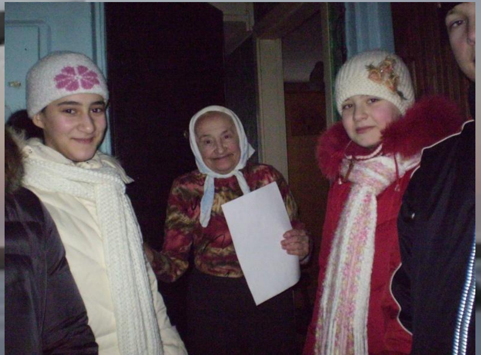
Вручение открытки блокаднице