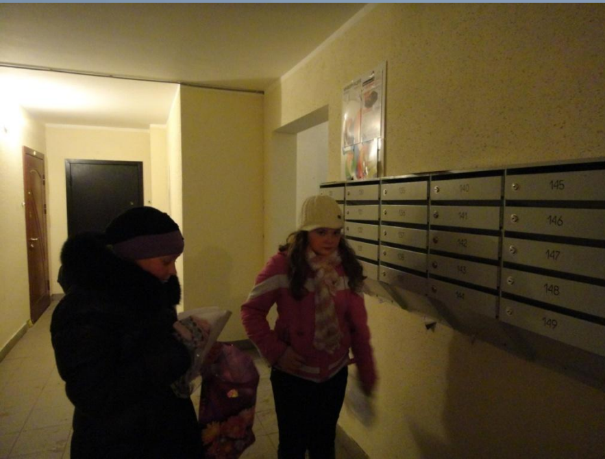
Разноска открыток по адресам