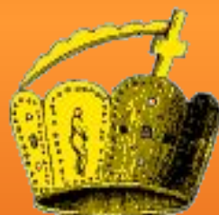
Корона Карла Великого