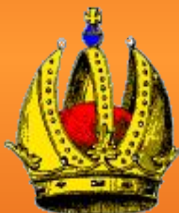
Германская императорская корона