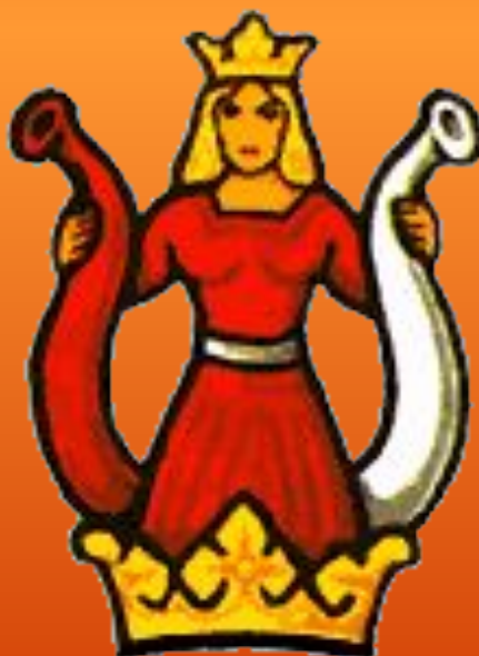
Рога с фигуркой