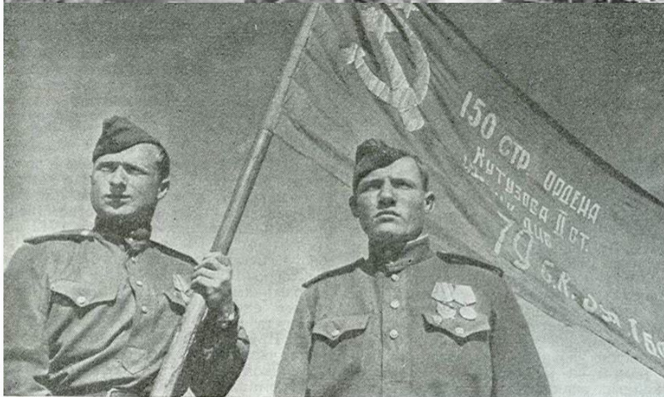
аэзвездчики 756-го полка 150-й стрелковой дивизии М. А. Егоров (справа) и Г. В. Кантария со Знаменем Победы. Берлин. Май 1945.