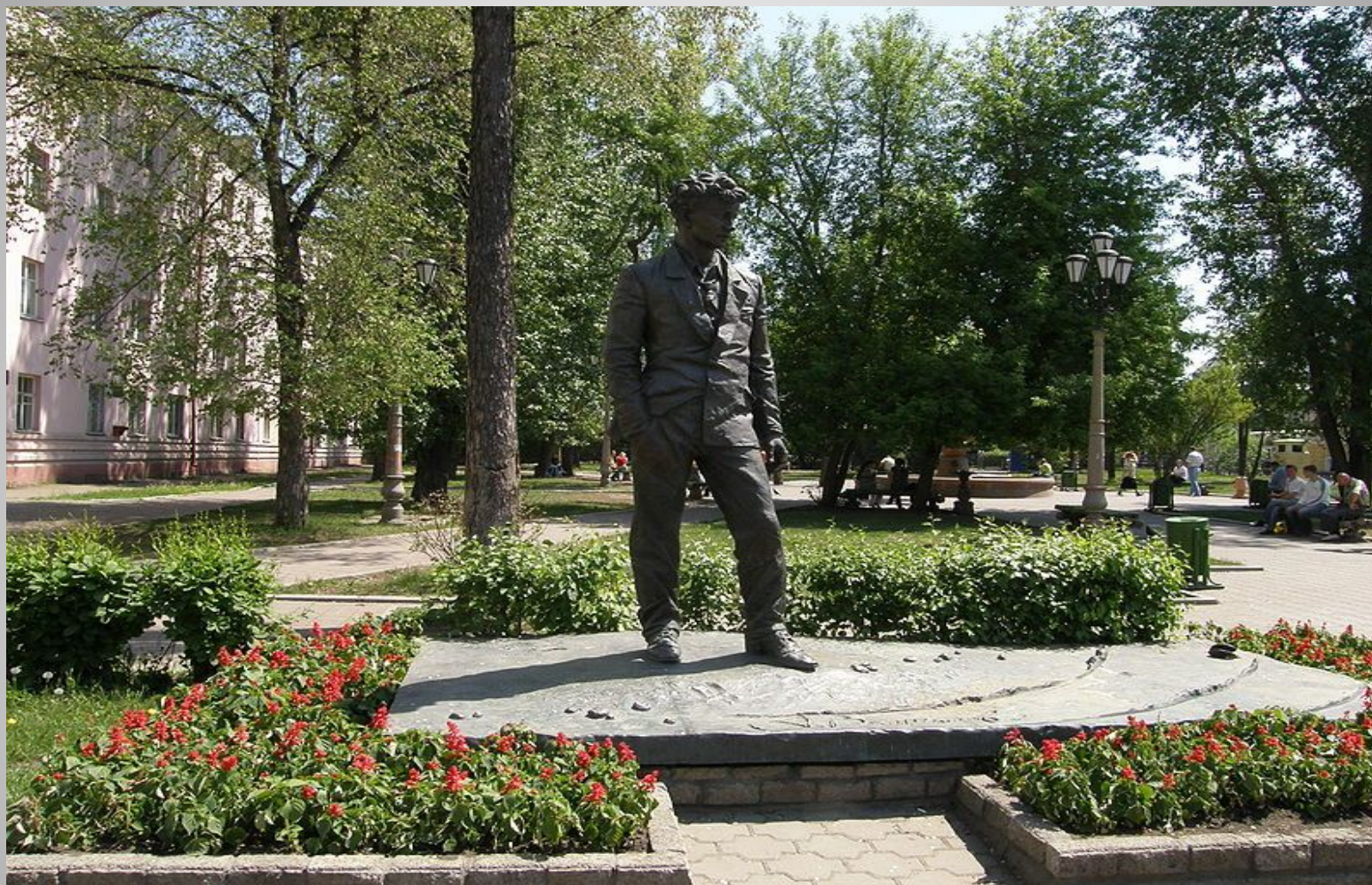
Памятник в Иркутске.