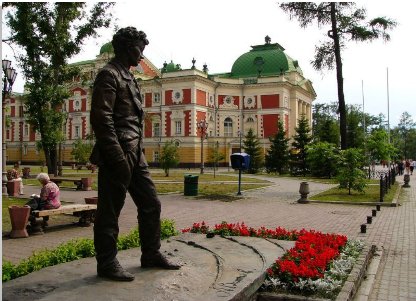
Музей драматурга Вампилова.