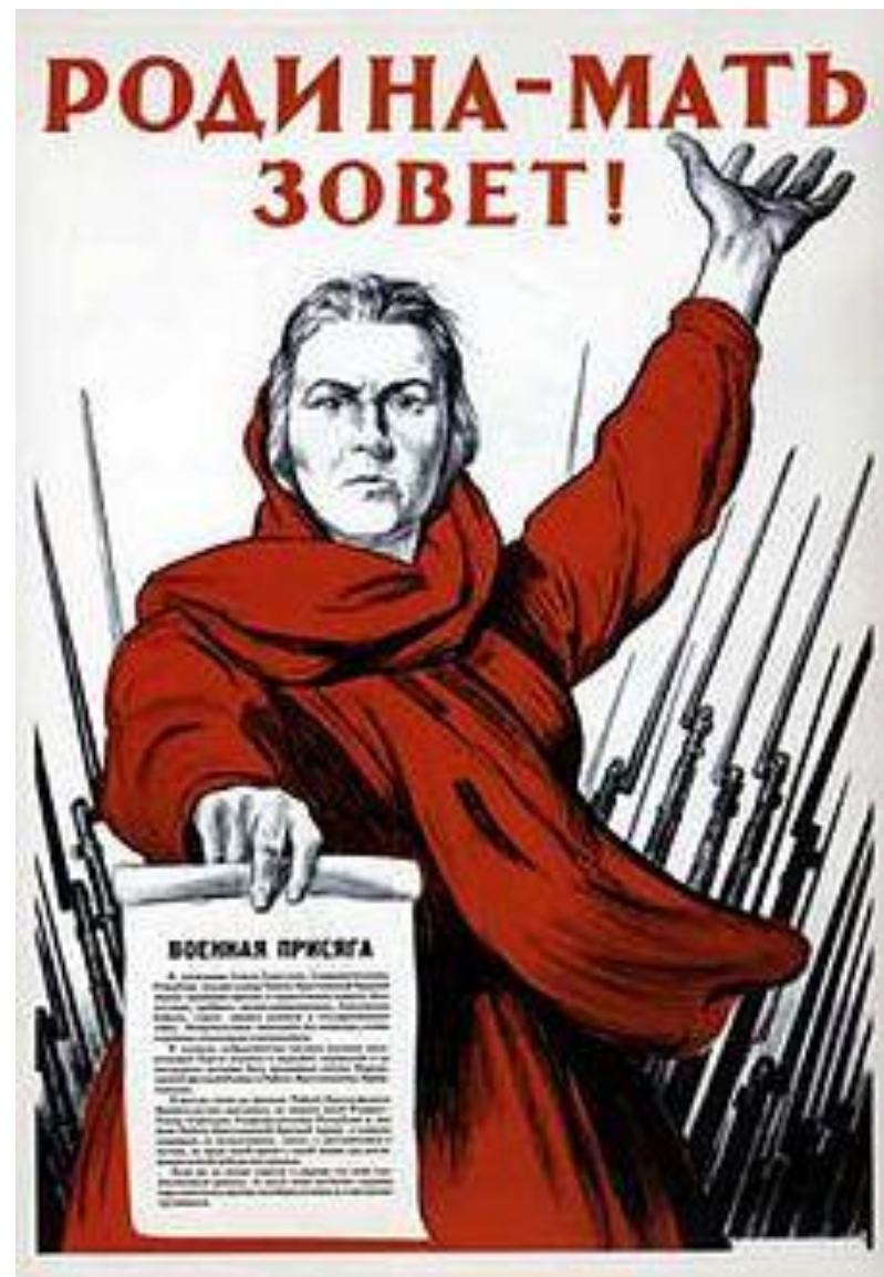
Плакат. Худ. И. Тоидзе, июнь 1941