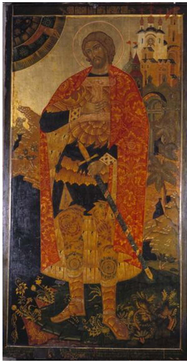
Князе-Владимирский собор. Икона Святого Александра Невского в соборе.