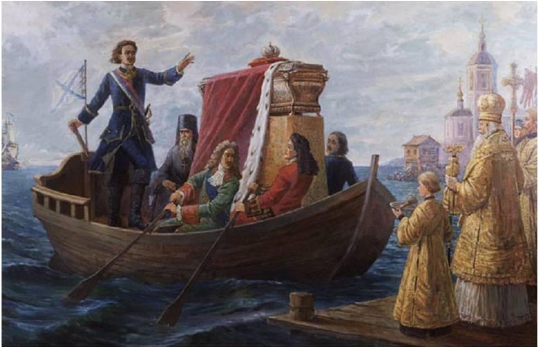
Перенесение императором Петром I мощей святого князя Александра Невского в Санкт-Петербург 30 августа 1724 года.