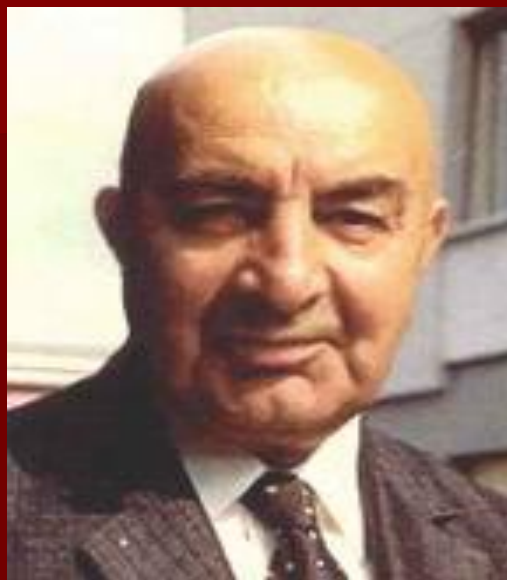
Мухаммед Дауд Хан

Двоюродный брат короля. 27 апреля 1978г. Дауд был свергнут в результате военного путча, проведенного фракциями коммунистической партии, объединившимися под названием «Народно-Демократическая Партия Афганистана».