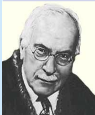
Карл Густав Юнг 1875-1961