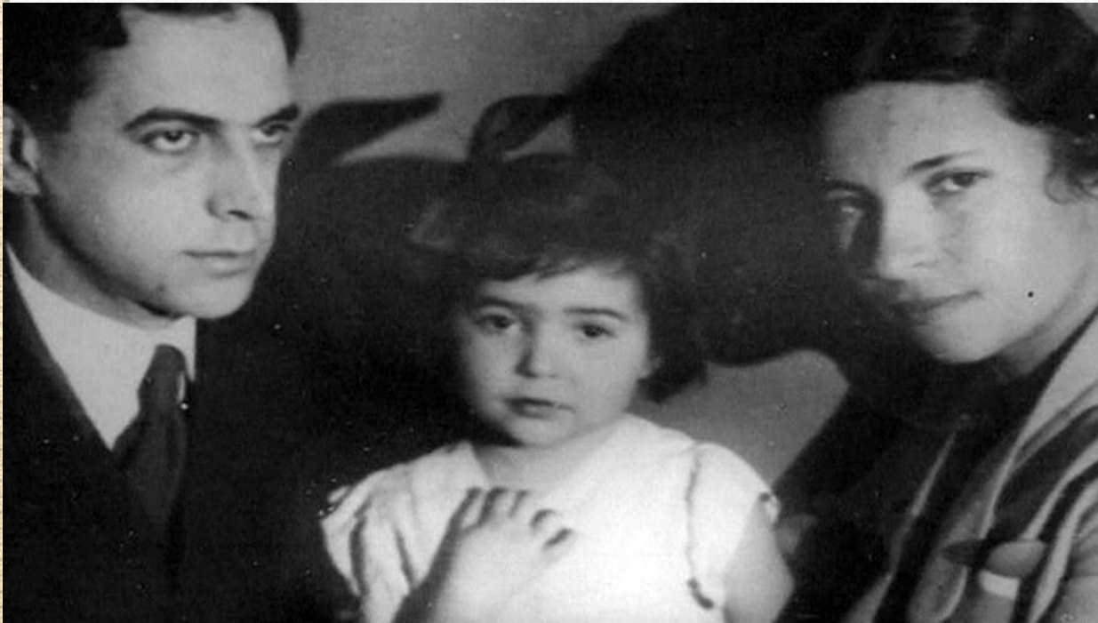
Агния Барто с родителями