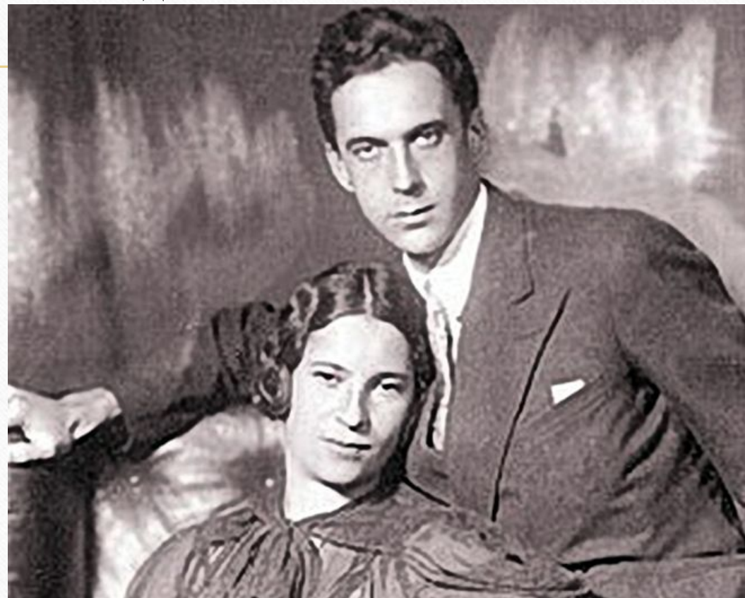
Агния Барто с мужем Андреем