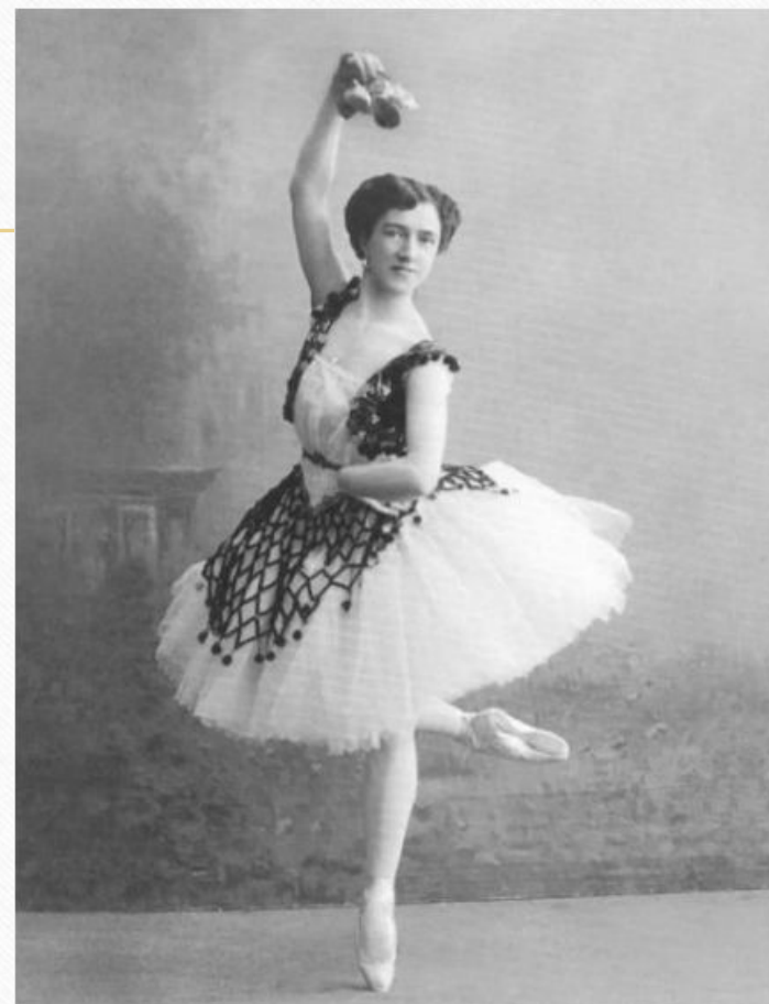
Агния Барто в балетной труппе