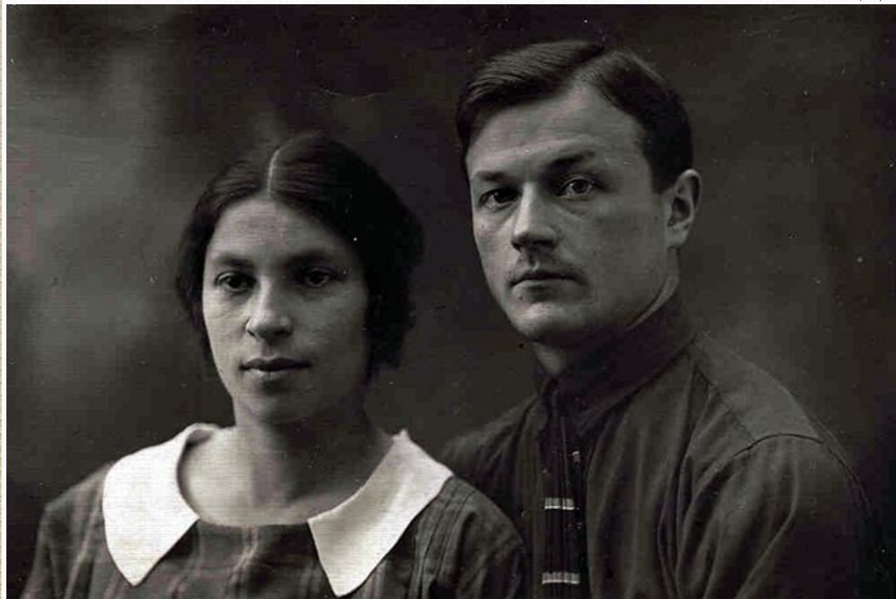
Агния Барто с первым мужем