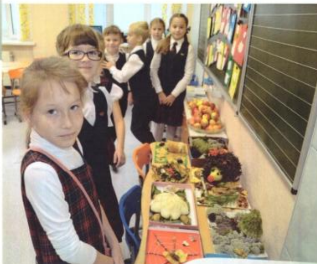
Выставка творческих работ учителей, ребят и родителей «Наши таланты»