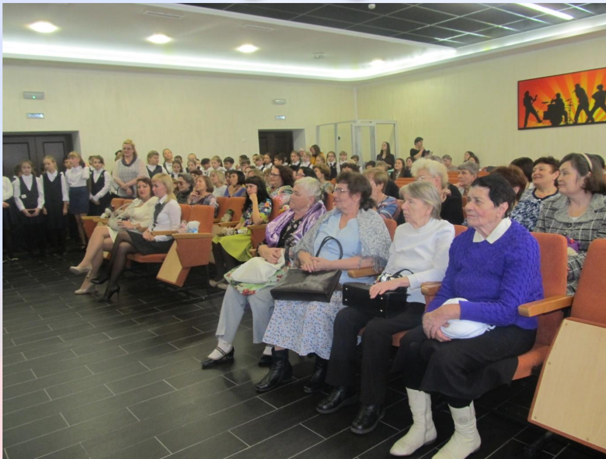
Праздничные концерты ко Дню пожилого человека и Дню учителя