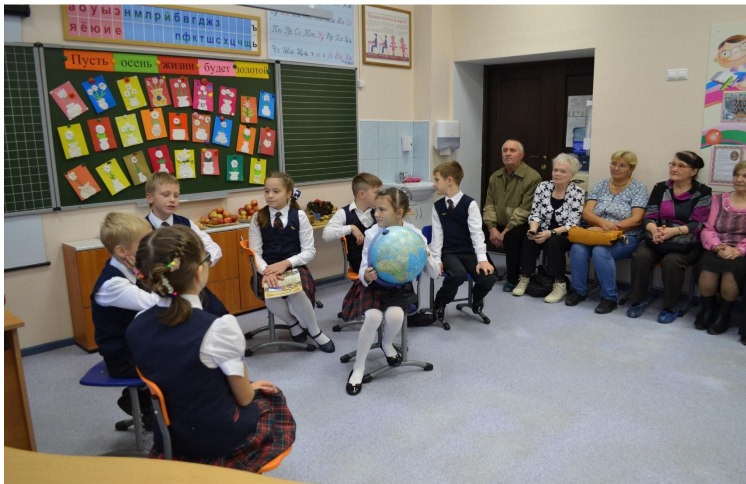
Праздничные концерты ко Дню пожилого человека 3 «Б» класс